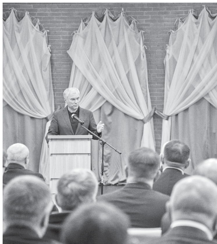
На встрече Вячеслав Володин обозначил проблемные вопросы региона.

политик поднял тему обеспечения жильём детей-сирот. Очередь образовалась на 13 лет, за это время они сами стали родителями и не могут получить жильё.