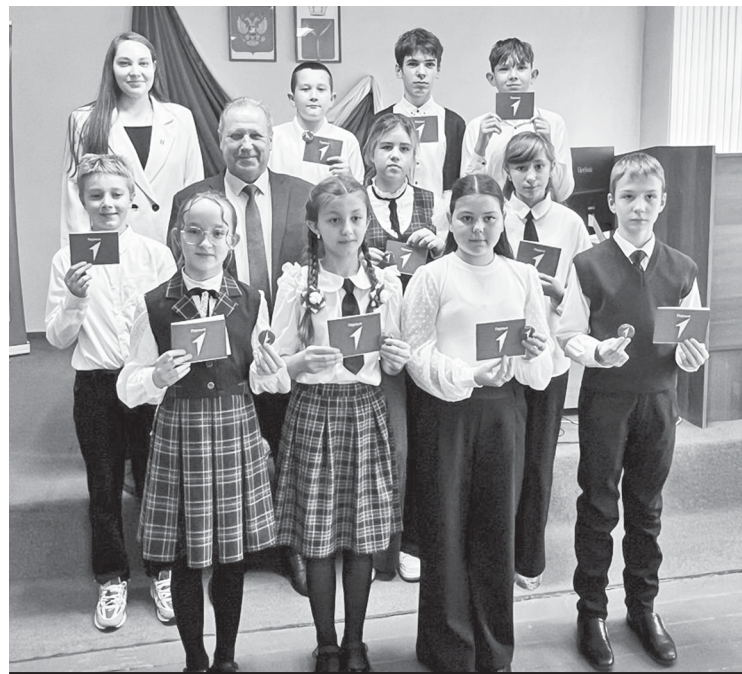
После мероприятия - фотография на память.