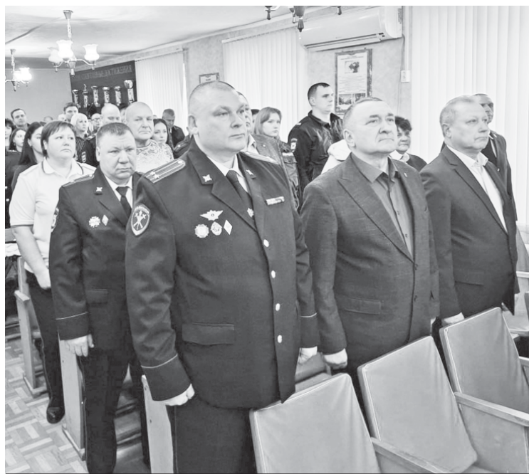
Фрагмент торжественного мероприятия.

10 ноября в Аркадаке состоялось торжество, посвящённое Дню сотрудника органов внутренних дел Российской Федерации. Праздник был посвящён тем, кто ежедневно стоит на страже правопорядка и защищает законные права граждан.