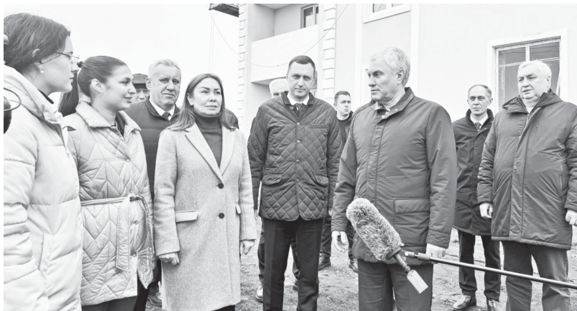
Вячеслав Володин на строительной площадке домов для врачей.