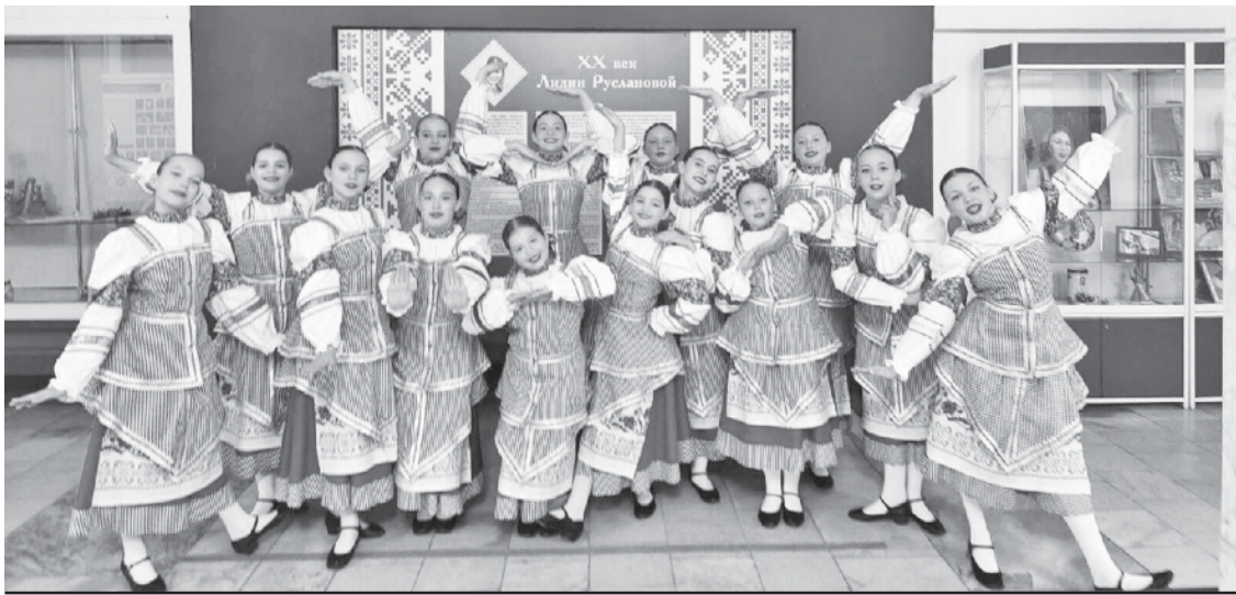
Ансамбль "Созвездие А".