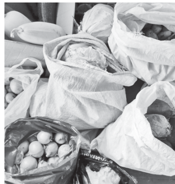
В последних посылках от аркадакских женщин - овощи с собственных огородов.