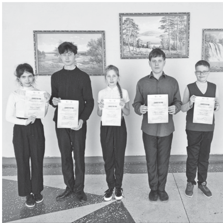
Юные журналисты городской школы № 1.