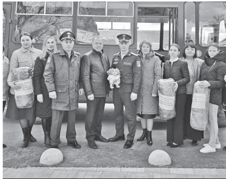
После встречи - фотография на память.