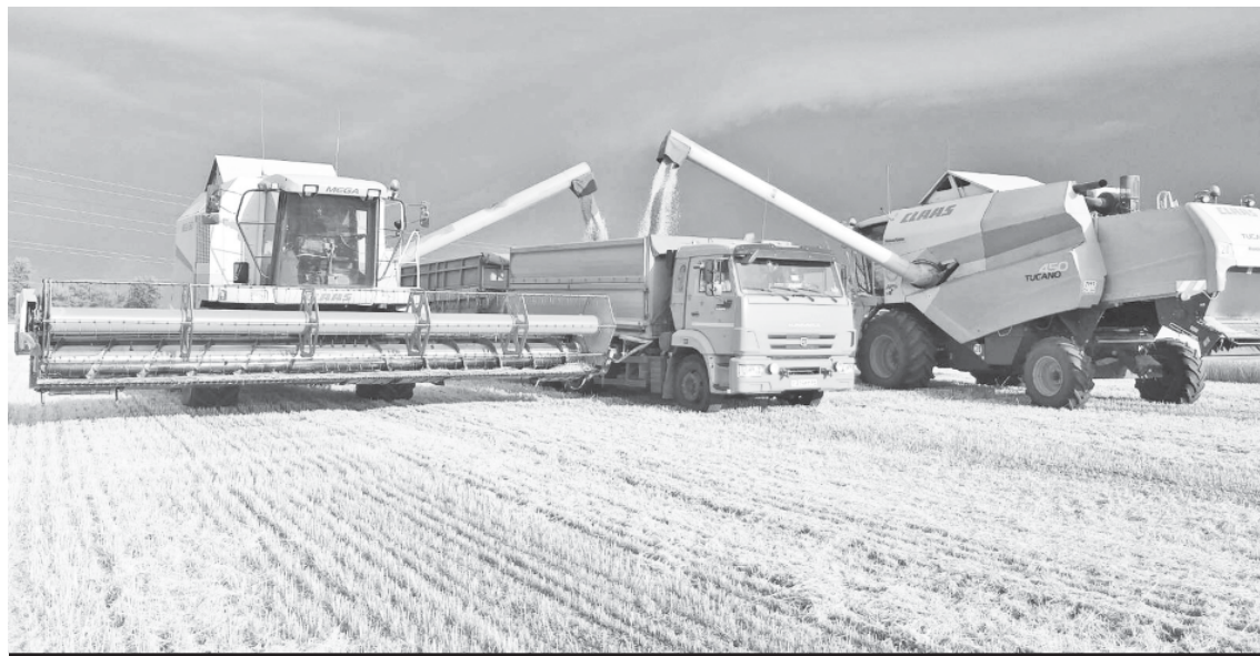
На полях Аркадакского района.