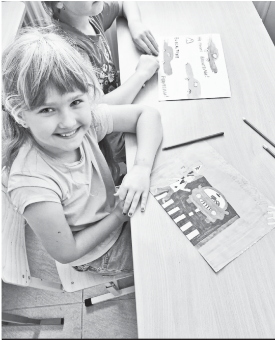
На занятиях с сотрудниками госавтоинспекции дети с удовольствием рисовали.

В летнее время дети много времени проводят на улице, у них пользуется большой популярностью двухколёсный транспорт и другие современные средства передвижения - самокаты, моноколёса, гироскутеры.