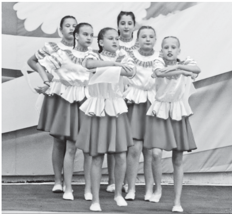
Фрагмент концертной программы.

Поздравление главы муниципалитета, вручение грамот, подарков, выступление местных и ольшанских артистов - вот основные моменты торжества в честь 190-летия села Росташа.