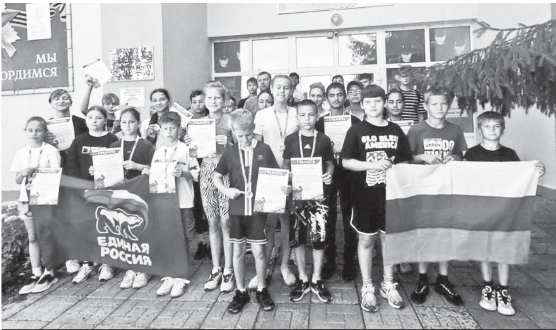
Школьники, сдававшие нормы ГТО.

Праздник в честь Дня физкультурника проходил на летней спортивной площадке Дворца спорта.