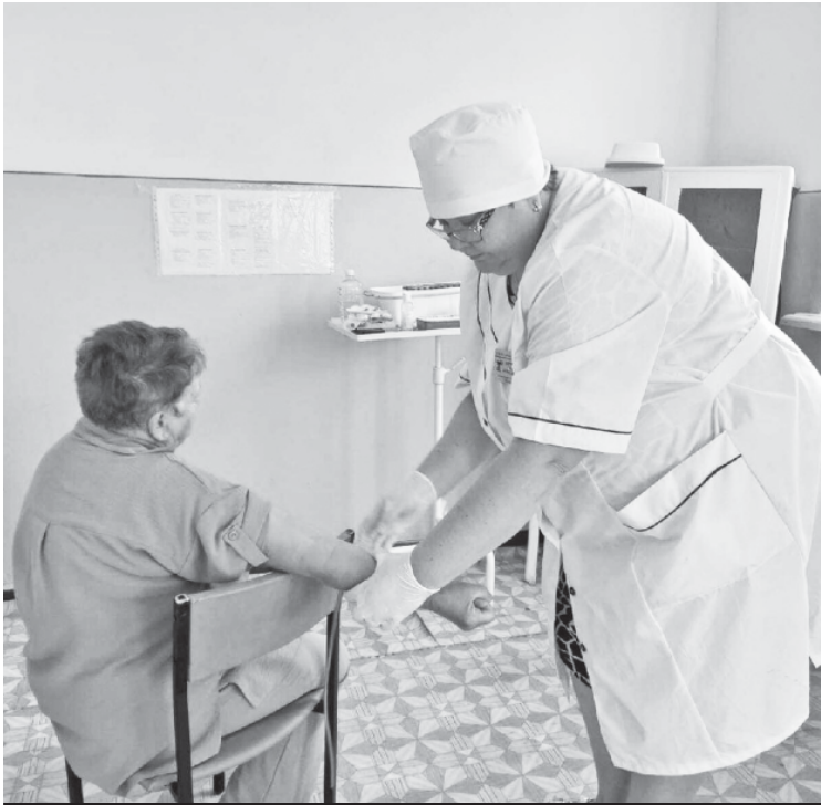
Медработники проводят диспансеризацию сельчан.