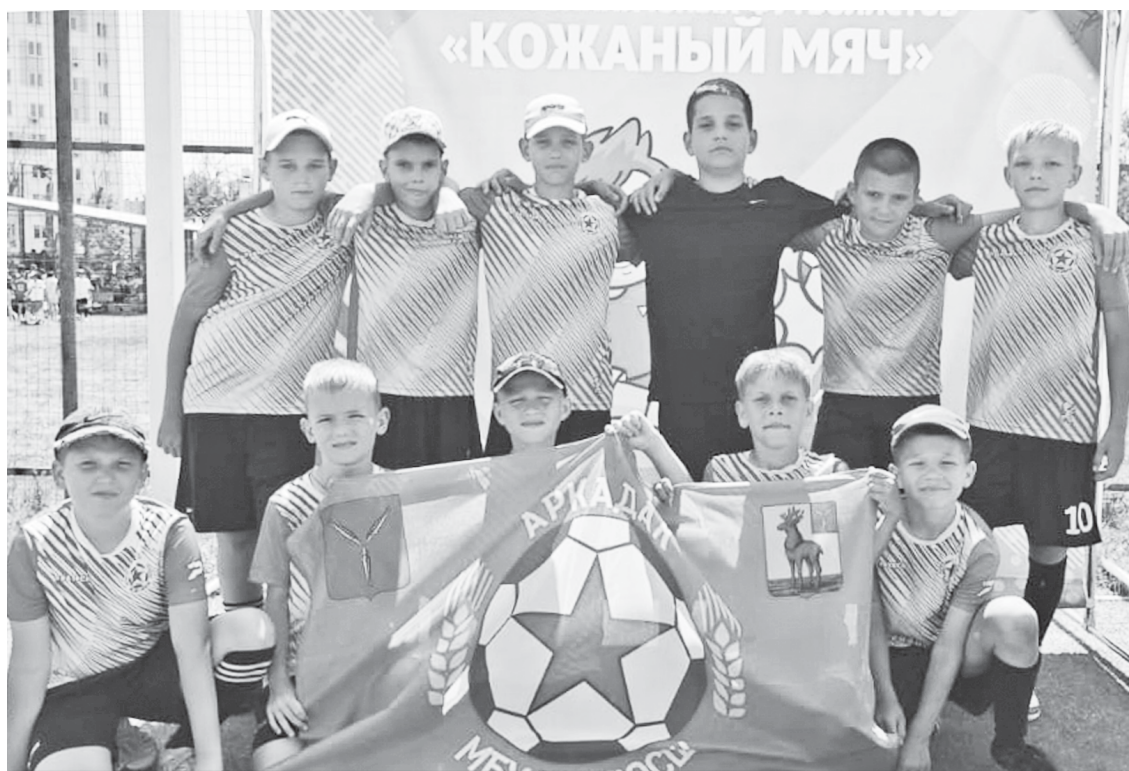
Команда юных футболистов 2014-2015 г. рождения г. Аркадака.