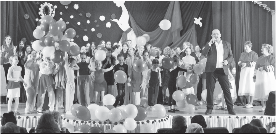
Фрагмент праздничной программы.