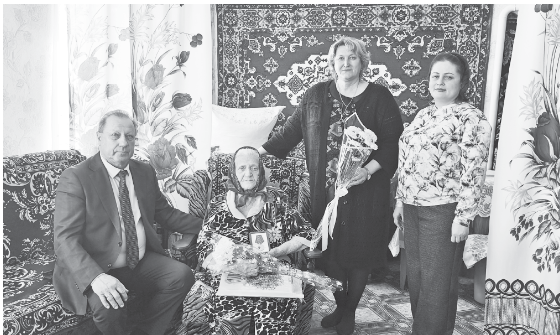
Вручение медали. Фотография на память.