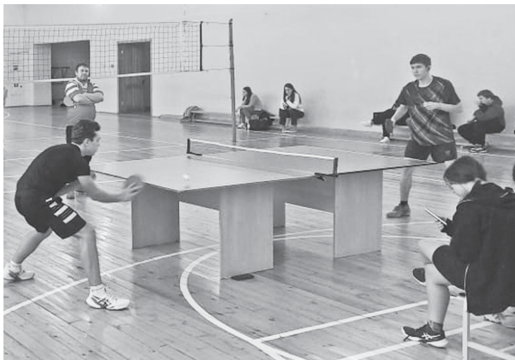
Соревнования по настольному теннису.

4 января во Дворце спорта прошли районные соревнования по настольному теннису на призы местного отделения партии "Единая Россия".