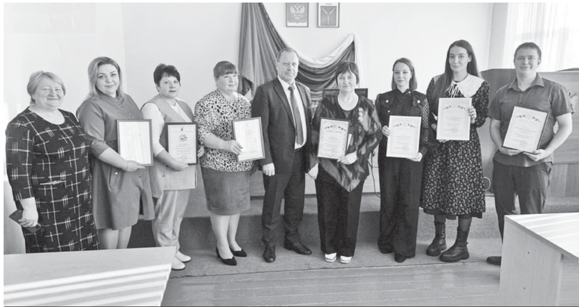
Награждение участников конкурса "Педагогический дебют - 2024".