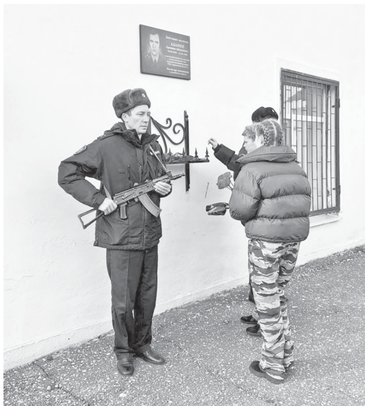
Возложение цветов к мемориальной доске.