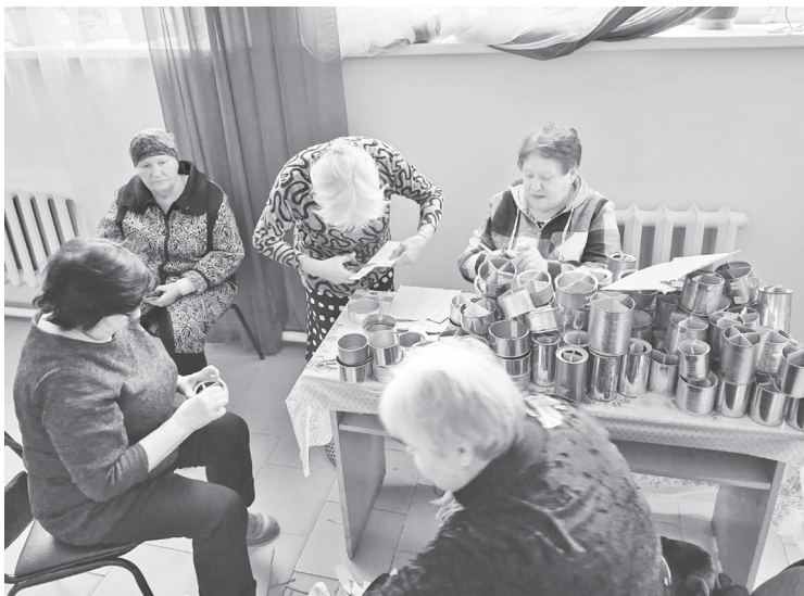
Кистендейские женщины объединяются и работают для фронта. При этом они поют.