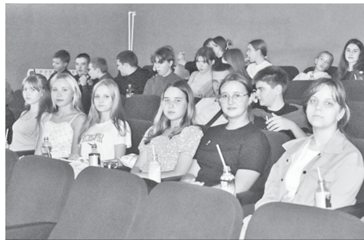
На киносеансе в кинотеатре "Мир".