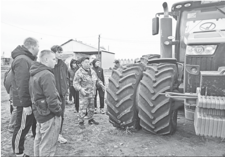
Студенты на экскурсии.