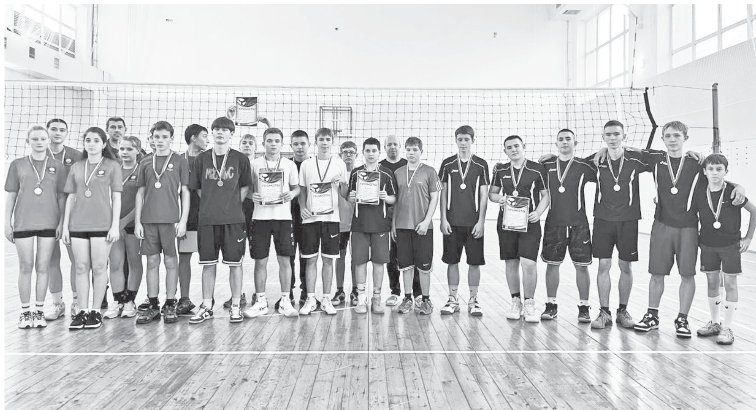
Юные спортсмены после соревнований.