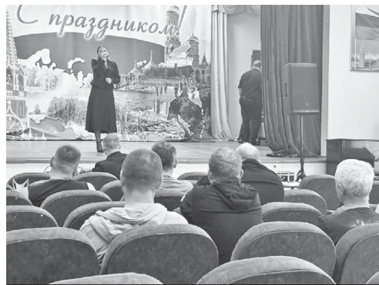
Фрагмент концертной программы.

Третий раз в нынешнем году артисты из Аркадакского района выезжали с концертами для бойцов СВО, проходящих курс лечения и реабилитации в Саратовских госпиталях.