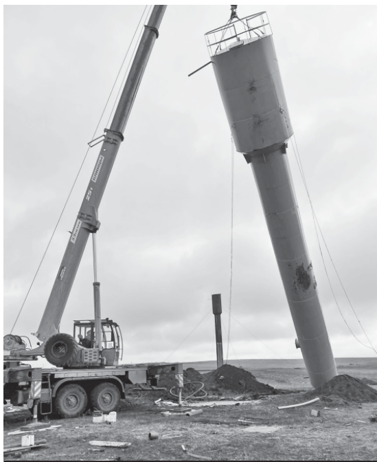
Идёт установка водонапорной башни.

Стальная напорная ёмкость снабжена системой автоматического поддержания воды в резервуаре, так что переполнение его исключено. К тому