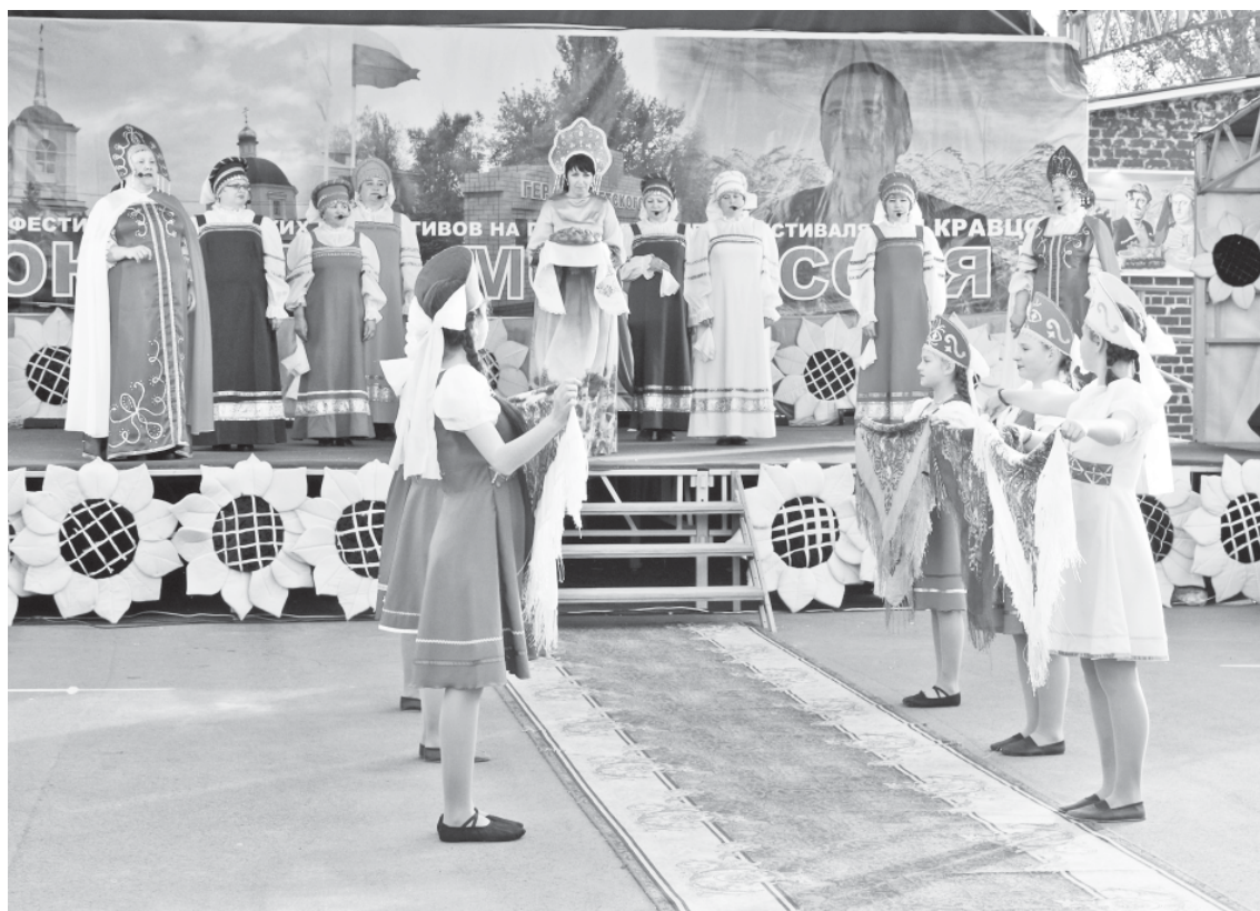
Выступление Росташовского СДК.