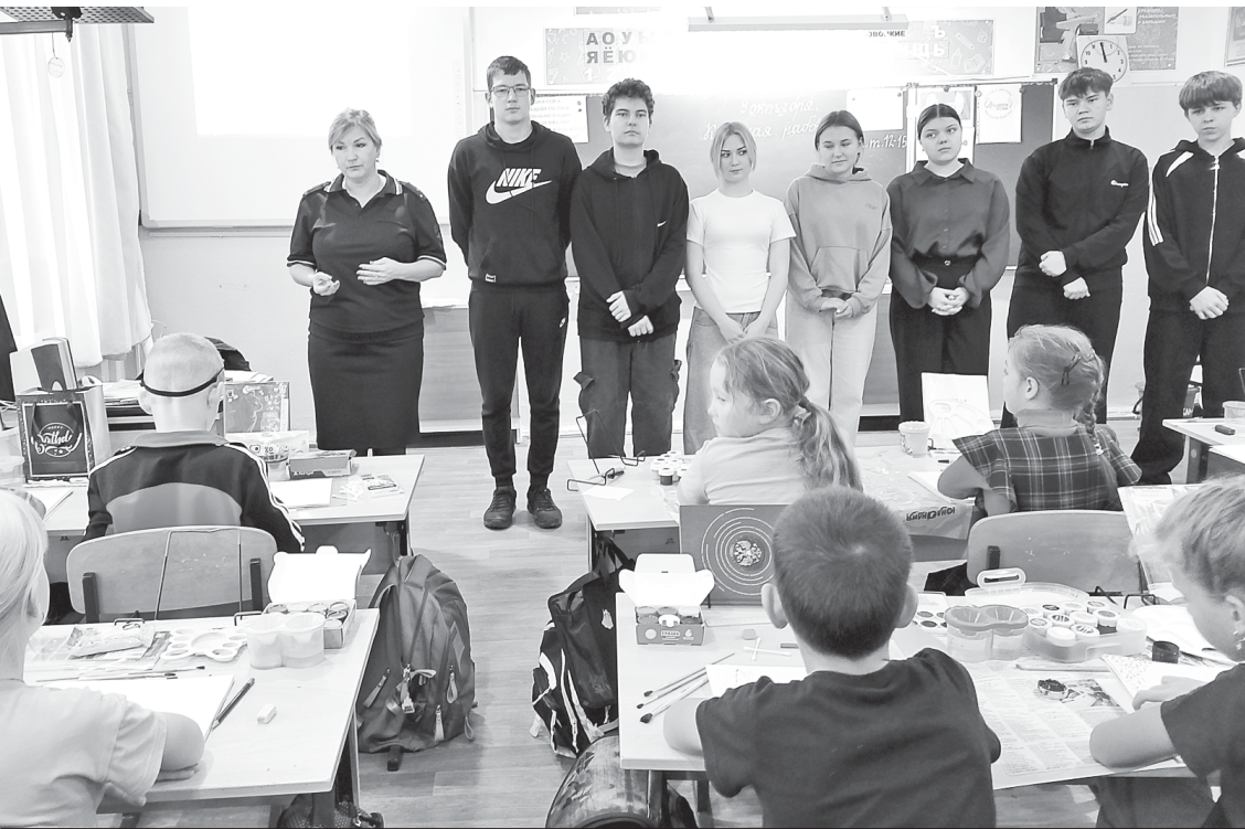
Профилактическая беседа о правилах безопасного поведения на улицах и дорогах.