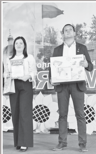
Фото Светланы МАРЕЕВОЙ. Коллаж Сергея СИДОРОВА.