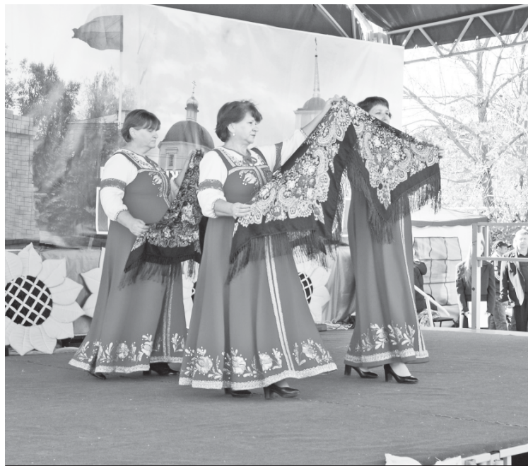
Выступление Баклушинского СДК.