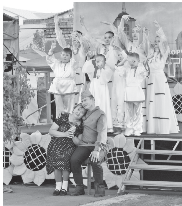
Выступление Семёновского СДК.