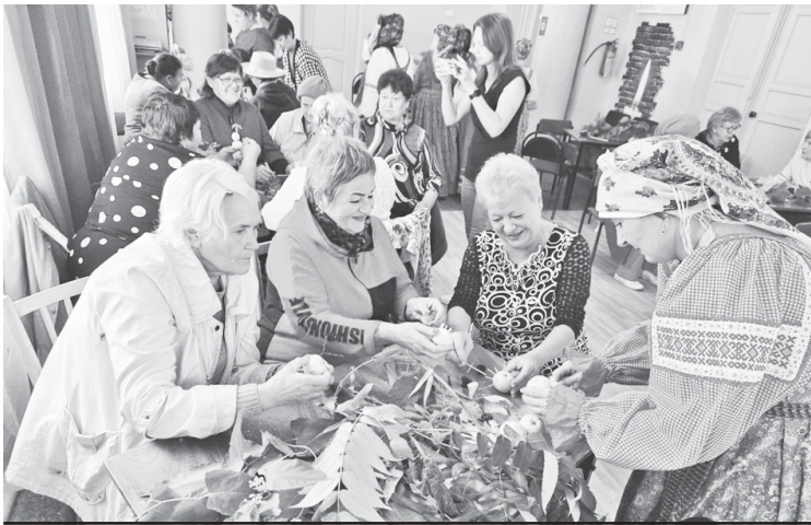
Занятия в рамках программы активного долголетия.

В Аркадакском районе для людей старшего поколения создана стройная система комплексной поддержки населения по различным направлениям.