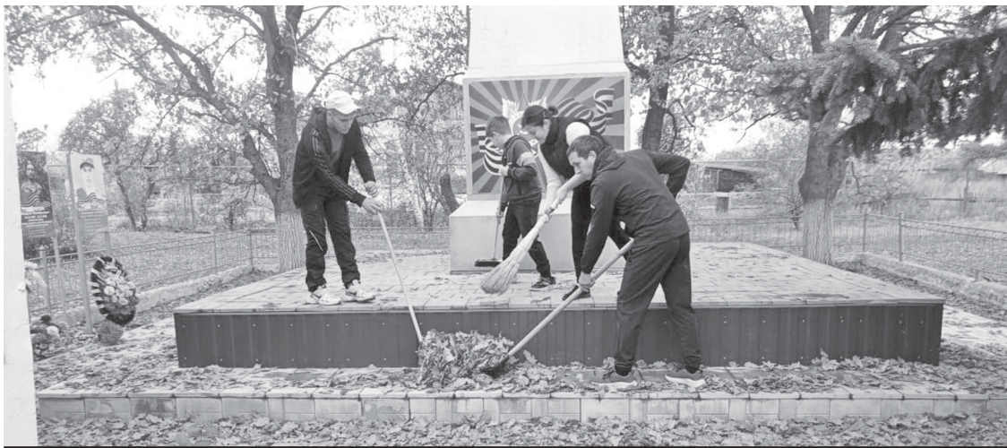
Идёт уборка территории сельского памятника.