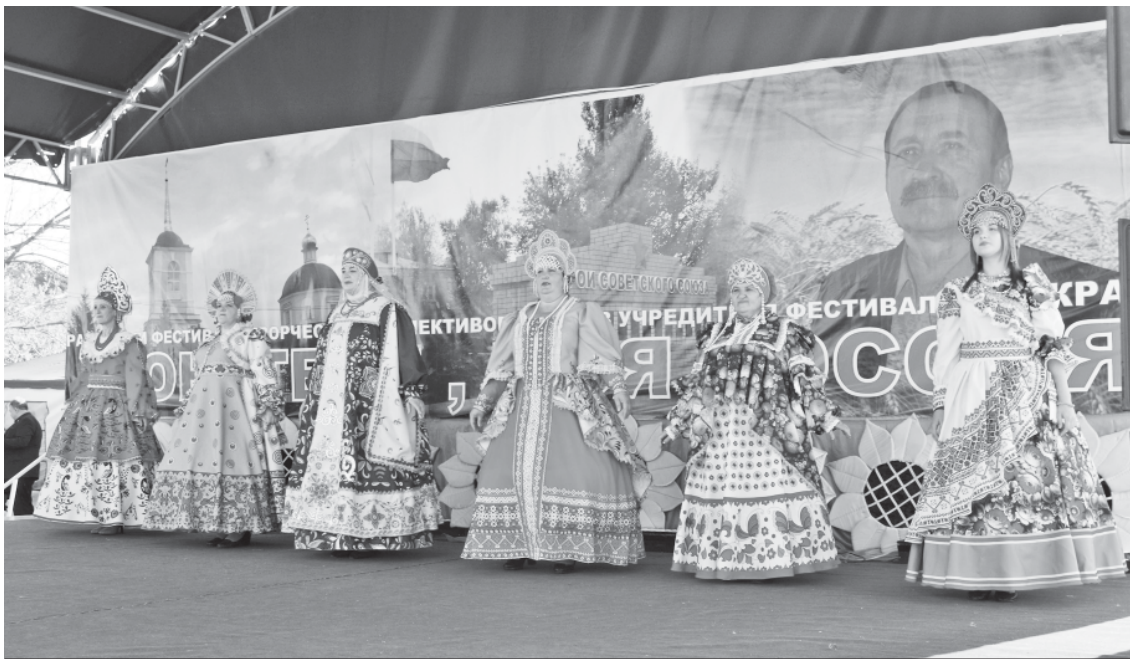
Выступление Львовского СДК.