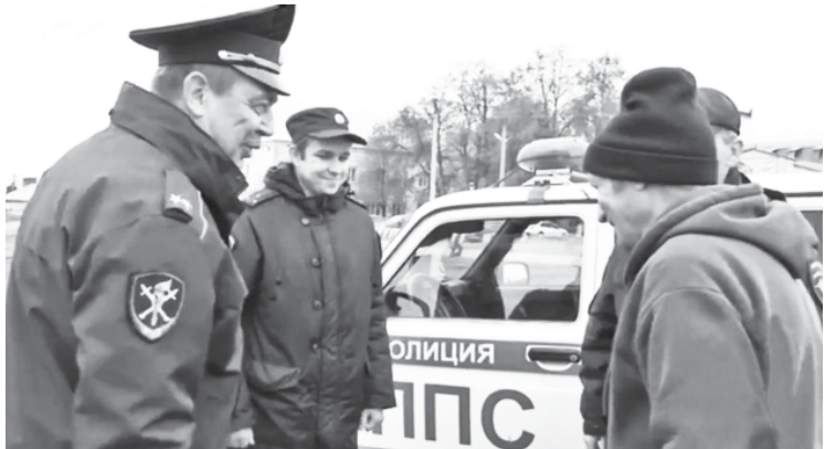
Кадр из видео от ГУ МВД России по Саратовской области.