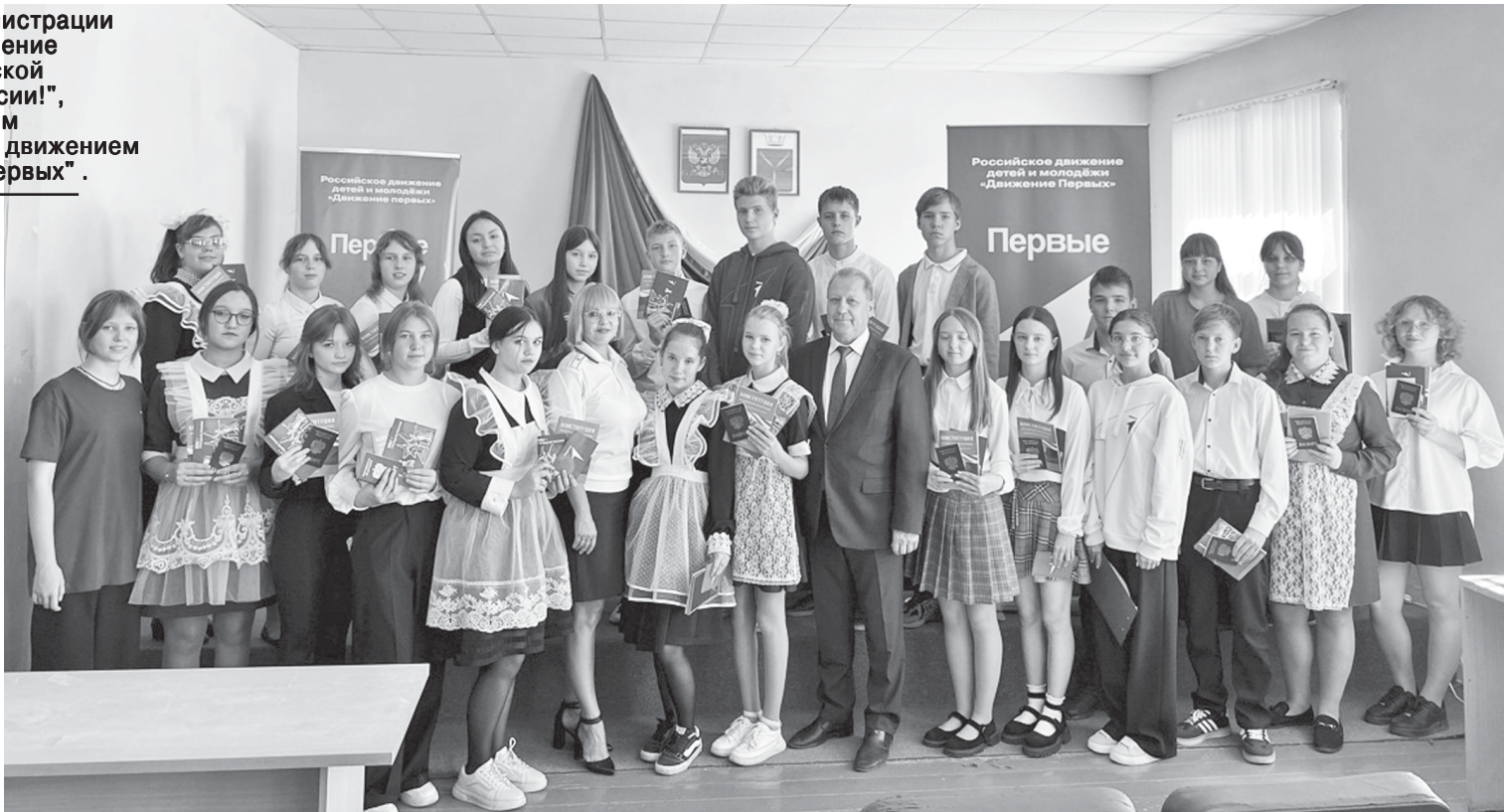
После мероприятия - фотография на память.