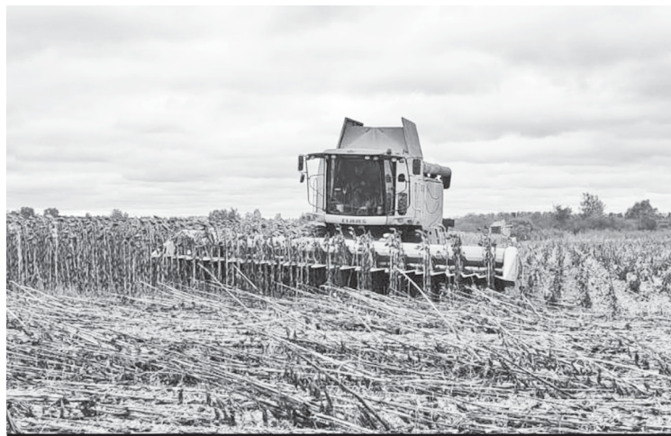
На аркадакских полях идёт уборка подсолнечника.

Если говорить про уборку подсолнечника, то в связи с благоприятными погодными условиями, темпы уборочной кампании