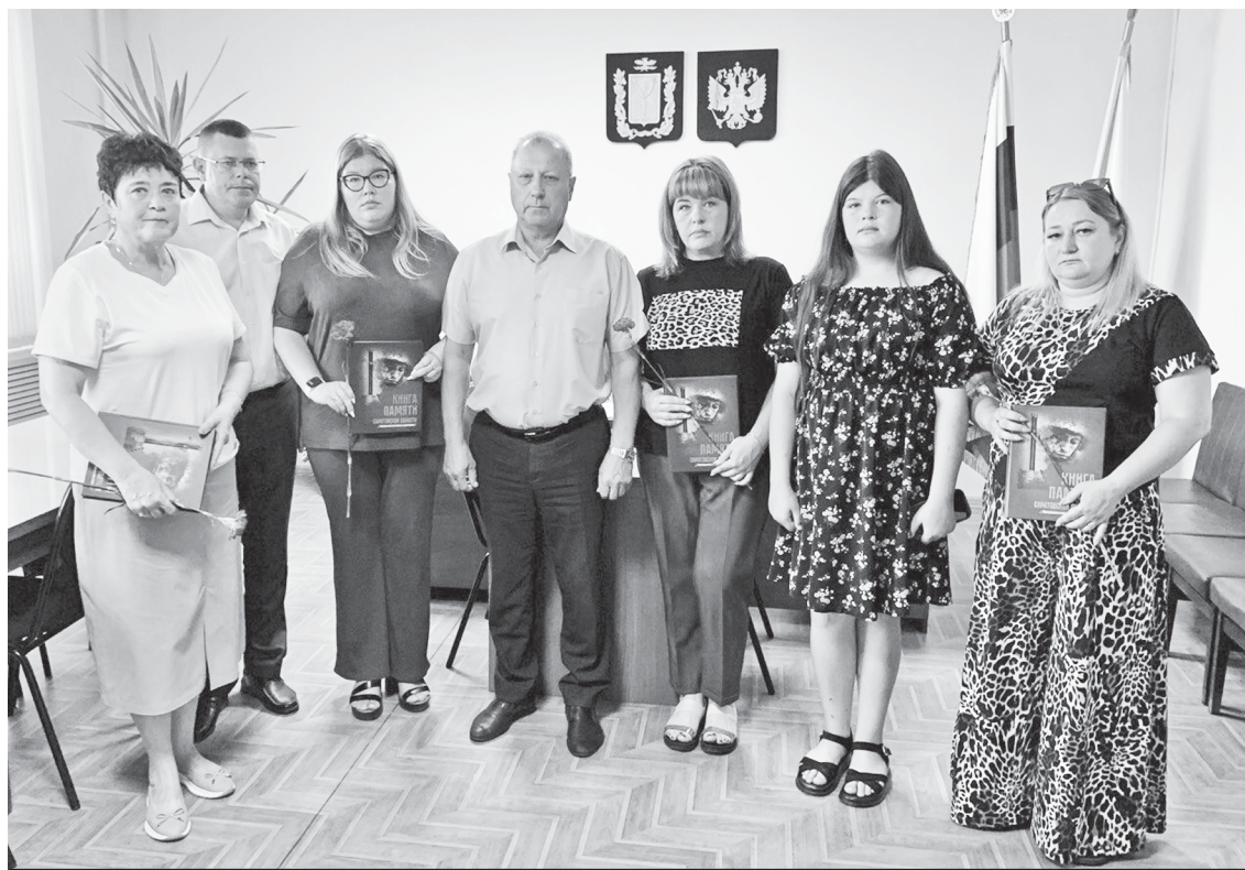
Момент вручения Книги памяти.