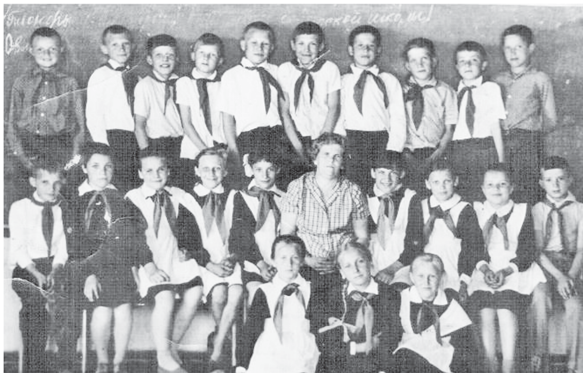
Ученики 4 класса 1968 года. После вступления в пионерскую организацию.

нания, но отопление в старой школе было печное. Печи топили дровами, которые поставлял для школы лесхоз. Двухметровые брёвна распиливали ученики старших классов на уроках труда, они же их кололи и готовые дрова убирали в сарай. Школьные печи были встроены в стену в каждом классе, а топки располагались в коридоре. Техники утром, до прихода учеников, топили печи. Долгое время техниками в школе работали