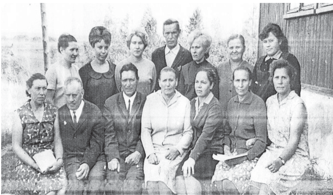
Коллектив учителей. 1970 год.