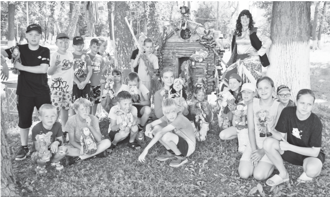
Охотнее всего дети фотографировались с Бабой Ягой.