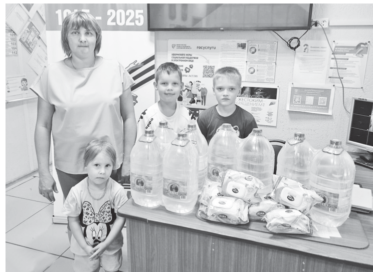
Взрослые помогли детям доставить гуманитарный груз в пункт сбора в Центре социального обслуживания населения.