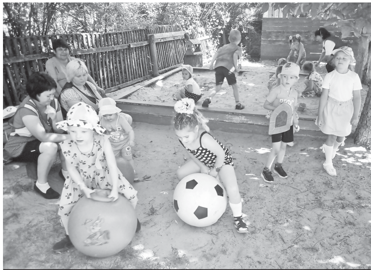
На территории садика большая детская площадка. На ней качели и карусели, горка и беседка. Детвора с удовольствием всем этим пользуется.