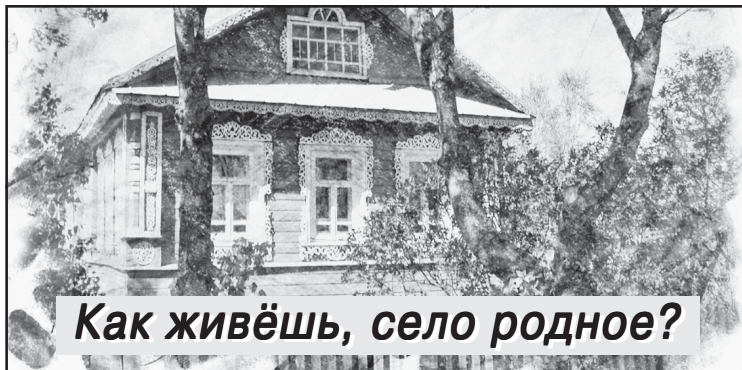
Как живёшь, село родное?