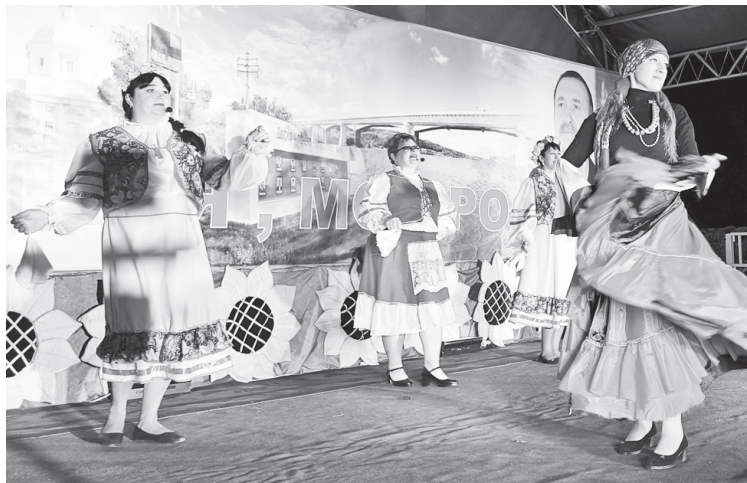
Выступление расташовцев на районном конкурсе "Пою тебя, моя Россия" в 2024 году.