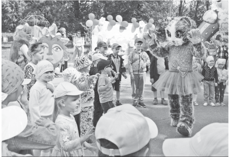
Сказочные персонажи веселили детвору, приглашали к участию в конкурсах.