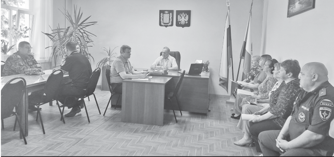
На заседании АТК в районной администрации.

Для координации работы по профилактике терроризма на региональном и муниципальном уровнях создаются межведомственные антитеррористические комиссии. Участвующие в них должностные лица органов местного самоуправления разрабатывают меры, направленные на повышение эффективности защиты населения от терроризма, осуществляют контроль выполнения предприятиями, учреждениями и организациями мер противодействия террористическим угрозам.