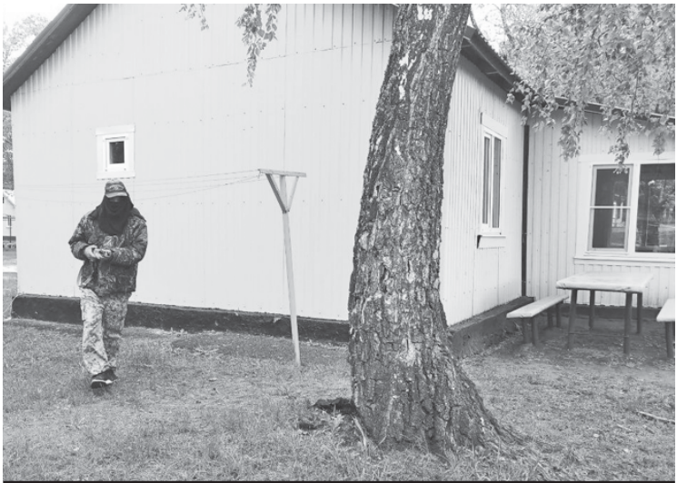
Антитеррористические учения на территории детского оздоровительного лагеря "Голубая ель".

на работа систем оповещения и эффективность оповещения без громкоговорителей. Отработано взаимодействие с оперативными службами и антитеррористической комиссией района. Продemonстрирована слаженность работы образовательных учреждений и оздоровительного лагеря с сотрудниками полиции, Росгвардии, спасателями, единой дежурно-диспетчерской службой муниципалитета.