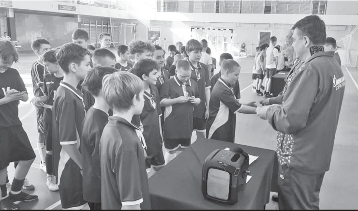
Аркадакская команда на соревнованиях.

противопожарного режима влечёт наложение административного штрафа: - на граждан от 40000 рублей до 50000 рублей; - на должностных лиц от 60000 рублей до 90000 рублей; - на юридических лиц от 600000 рублей до 1000000 рублей. Примечание. За административные правонарушения, предусмотренные настоящей статьёй (8.32 "Нарушение правил пожарной безопасности в лесах"), лица, осуществляющие предпринимательскую деятельность без образования юридического лица, несут административную ответственность как юридические лица. Кроме того, предусматривается и уголовная ответственность за нарушение правил пожарной безопасности, повлекшее пожар с крупным материальным ущербом и гибелью людей, либо за умышленный поджог.