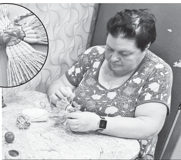
За изготовлением оберегов.

ребята знают, что их ждут в родных краях, - говорят сельские мастерицы.