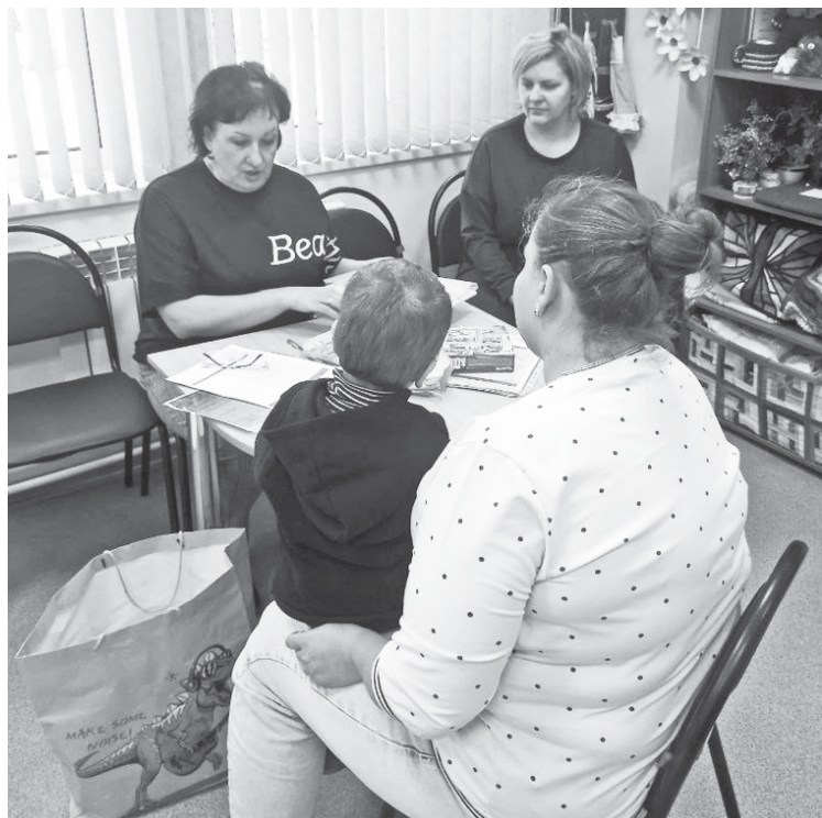
Приём ведут областные специалисты.