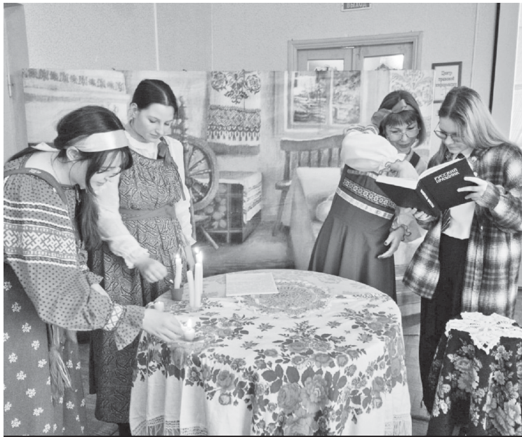
Фольклорные посиделки в детской библиотеке.

Библиотекари Аркадакской центральной районной библиотеки организовали на днях фольклорные посиделки под названием "Пришли Святки, начались колядки".