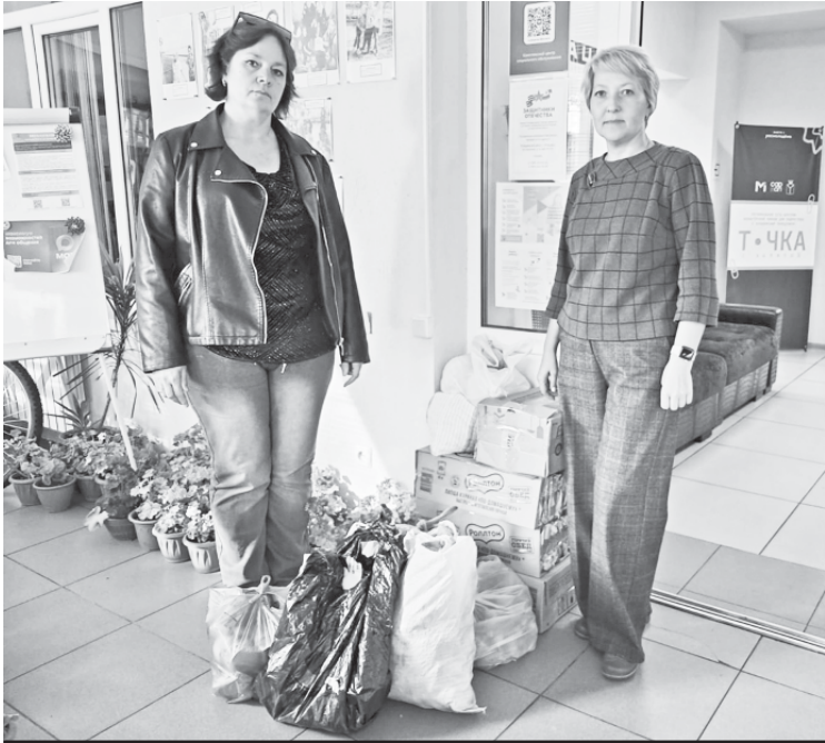
Гуманитарный груз передан в Центр соцобслуживания.

цев. Четверо из них погибли. Их имена занесены в Книгу