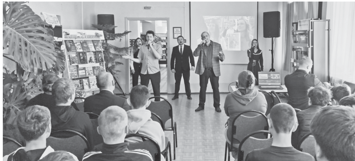
Фрагмент концертной программы для призывников.