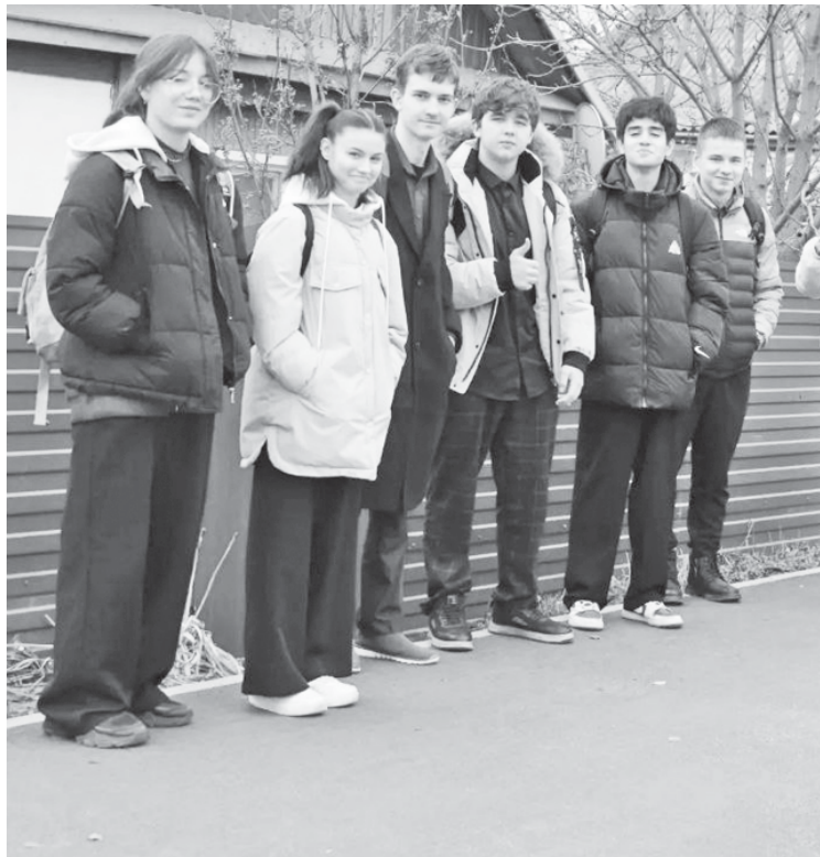
Старшеклассники городской школы № 1 с удовольствием идут в школу по новому тротуару.