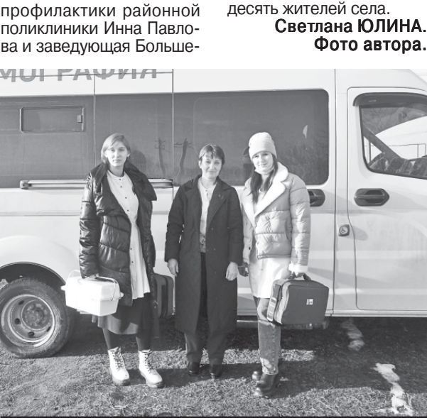
Медицинская бригада на выезде.

Медицинские работники: медсестра кабинета