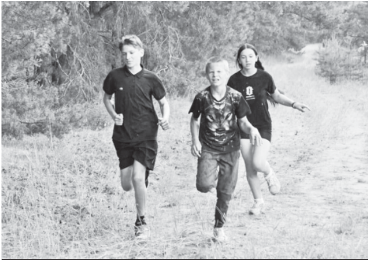
Нормативы по бегу сдавали прямо на лесных дорожках.

Мастера профессионального обучения Аркадакского техникума механизации сельского хозяйства встретились с учащимися школ рабочего посёлка Турки и Турковского района, чтобы рассказать им о своём учебном заведении.