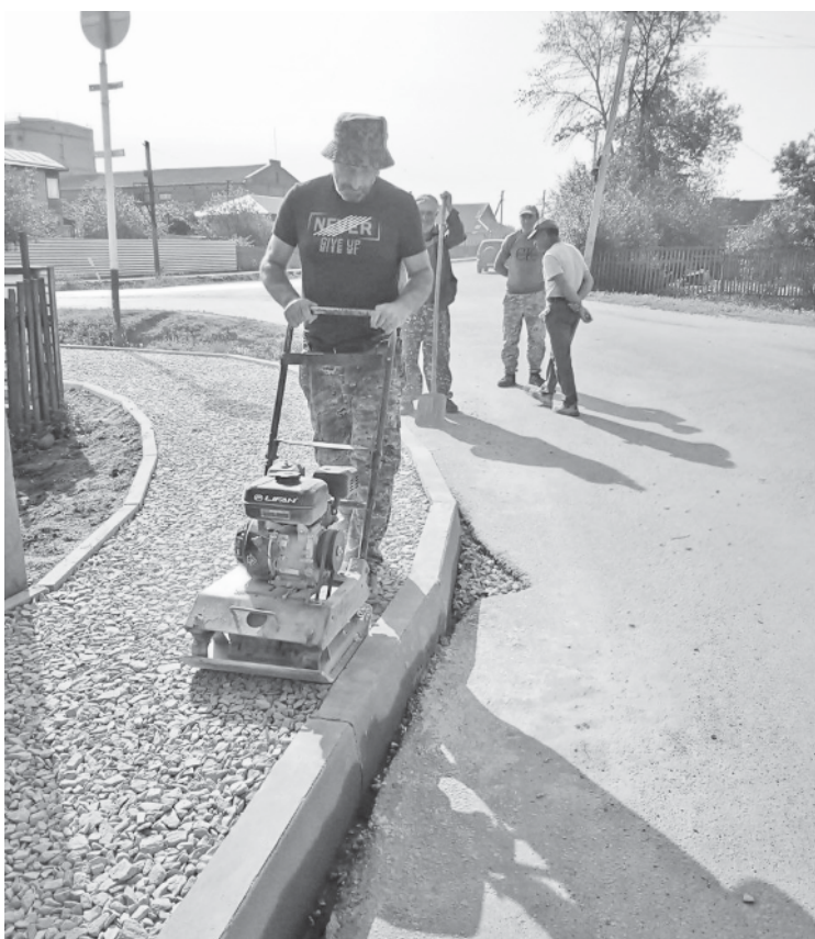
Наш корреспондент запечатлел последние штрихи работы дорожников перед укладкой асфальта.