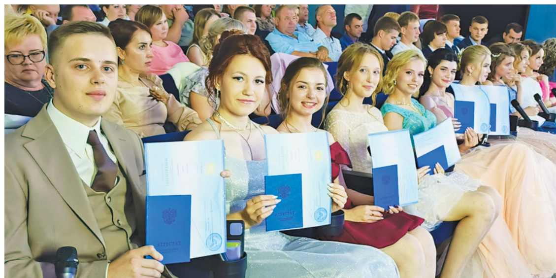
Аттестаты вручены выпускникам второй школы.

где был парад планет, где все поделились своими мечтами. Выпускной бал прошёл под названием "Мечта - 2025".