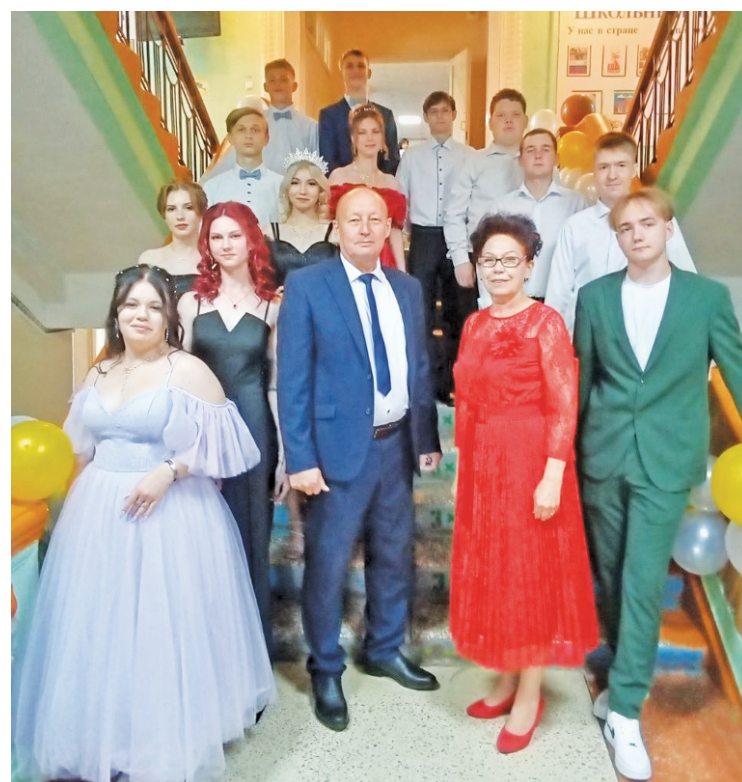
Выпускники первой школы. Фотография с учителями на память.

В городской школе № 2 выпускной прошёл в виде большого космического путешествия,