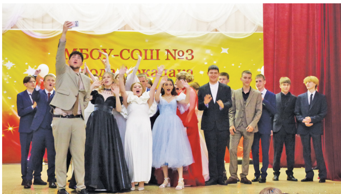
Последнее селфи на память о школьной жизни.