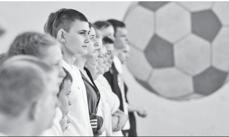
Спортсмены на старте.

На церемонии открытия участников приветствовали и.о. на-