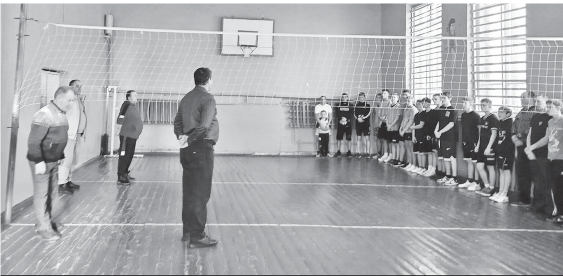
Перед началом турнира - построение.