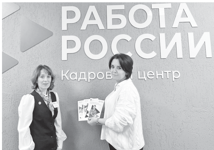
В Кадровом центре города Аркадака.

13 человек прошли обучение в рамках федерального проекта