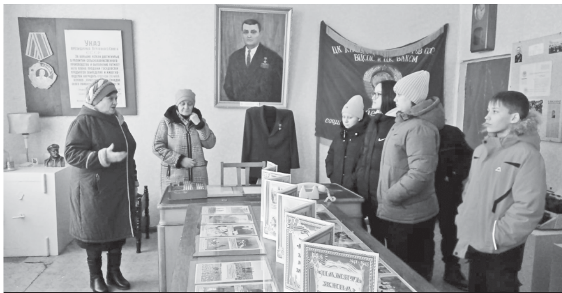
В сельском краеведческом музее представлен не только быт жителей из прошлого, история ордена Ленина колхоза "Красное знамя", но и военная история.

Президент Российской Федерации В.В. Путин объявил 2025 год - Годом защитника Отечества и 80-летия Победы в Великой Отечественной войне 1941-1945 годов. Год защитника Отечества - это не просто календарная дата, а символ национального единства и патриотизма.