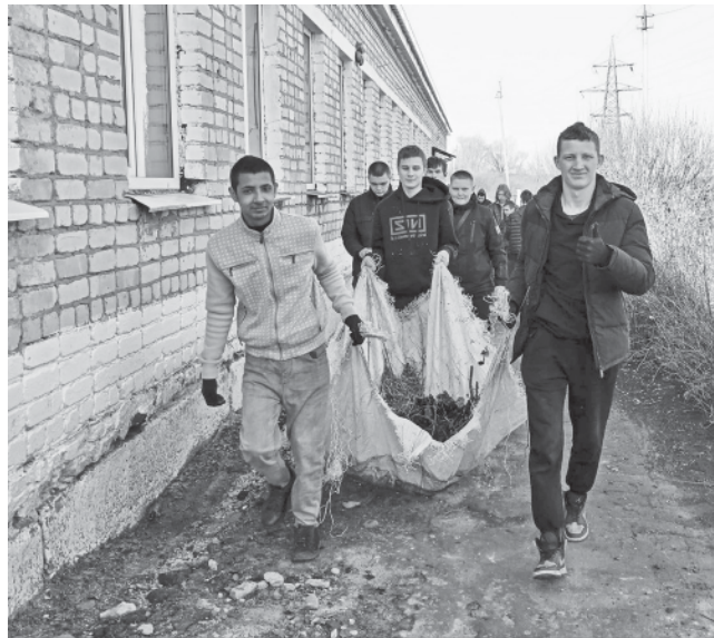
Студенты на уборке территории техникума.

Преподаватели и студенты Аркадакского техникума механизации сельского хозяйства провели первый в этом году субботник.