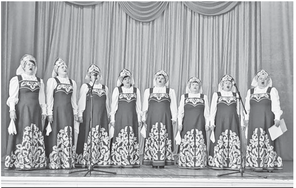
Выступает хор "Зоренька".