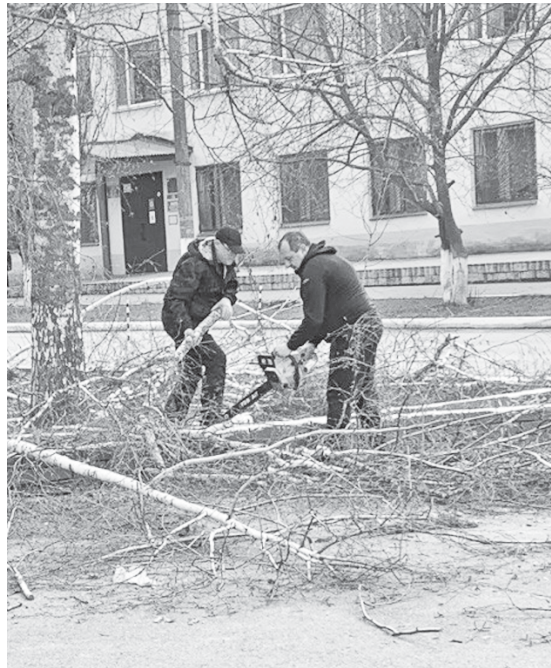
Работники администрации убираются на городской площади.