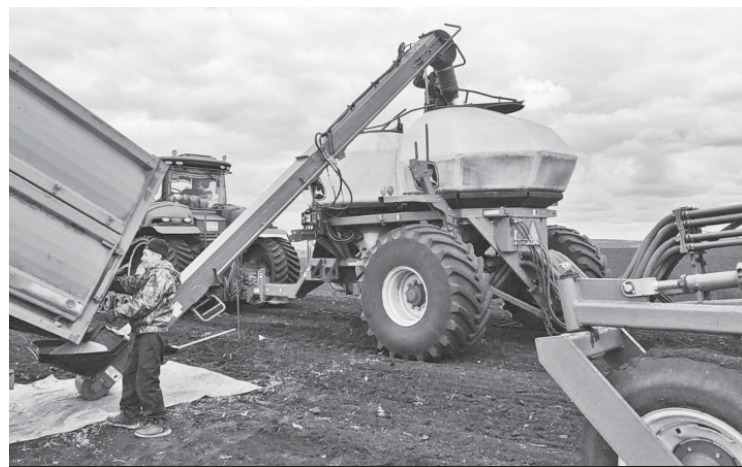
Идёт засыпка зерна в посевной агрегат.