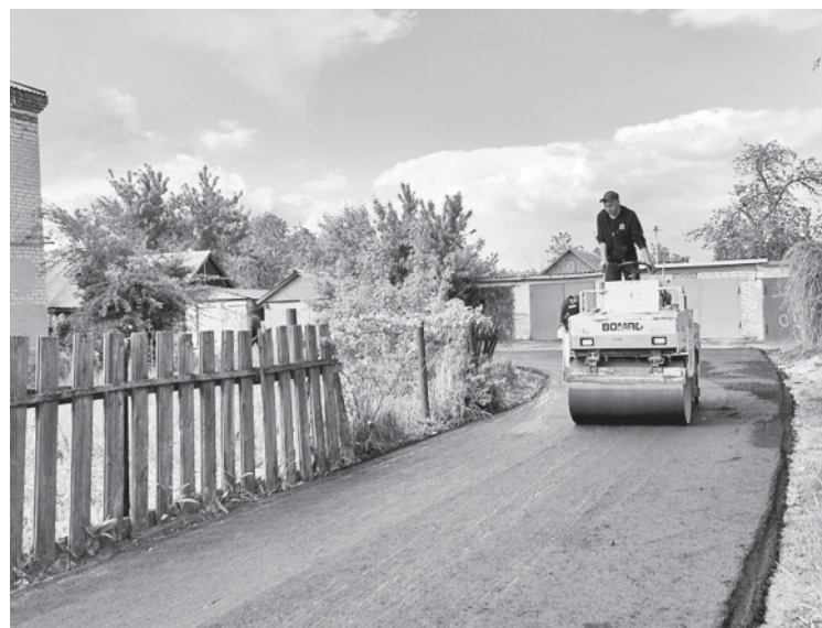
Благоустройство во дворе дома по улице Ленина.