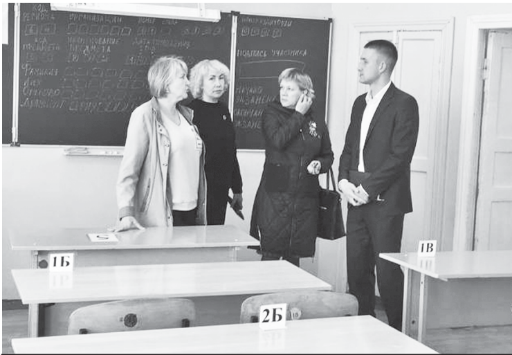
Проверка исполнения законодательства в городской школе № 1.

В период проведения экзаменов обычно устанавливается жар-