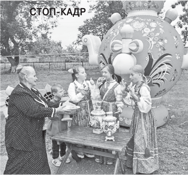
Работники районного Дома культуры провели для аркадакских девочек и мальчишек весёлый праздник, приуроченный ко Дню самовара. Мероприятие называлось "К самовару приглашаем, вкусным чаем угощаем!". И действительно, работники РДК и "серебряные" волонтеры угостили ребят пирогами и сладостями. В празднике принял участие фольклорный ансамбль "Потешки", который подарил всем присутствующим незабываемые музыкальные номера. Светлана ЮЛИНА.