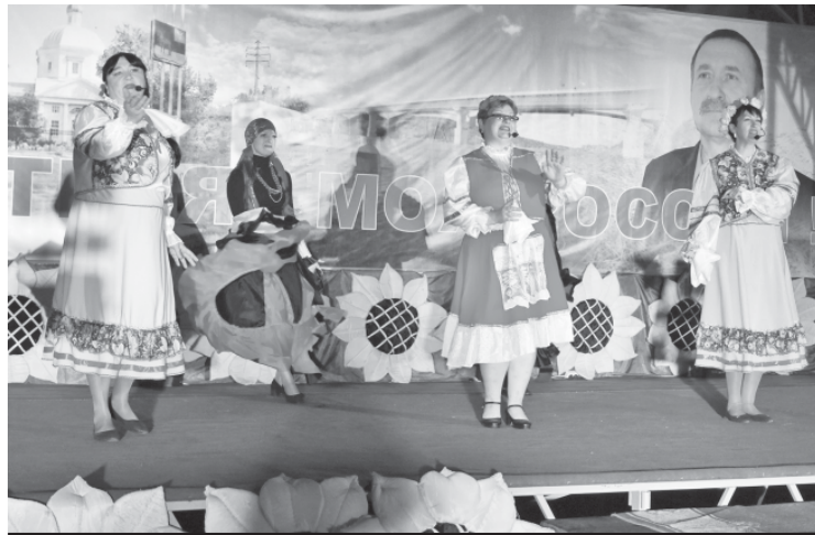
Вокальный ансамбль "Сударушки" Росташовского сельского Дома культуры.