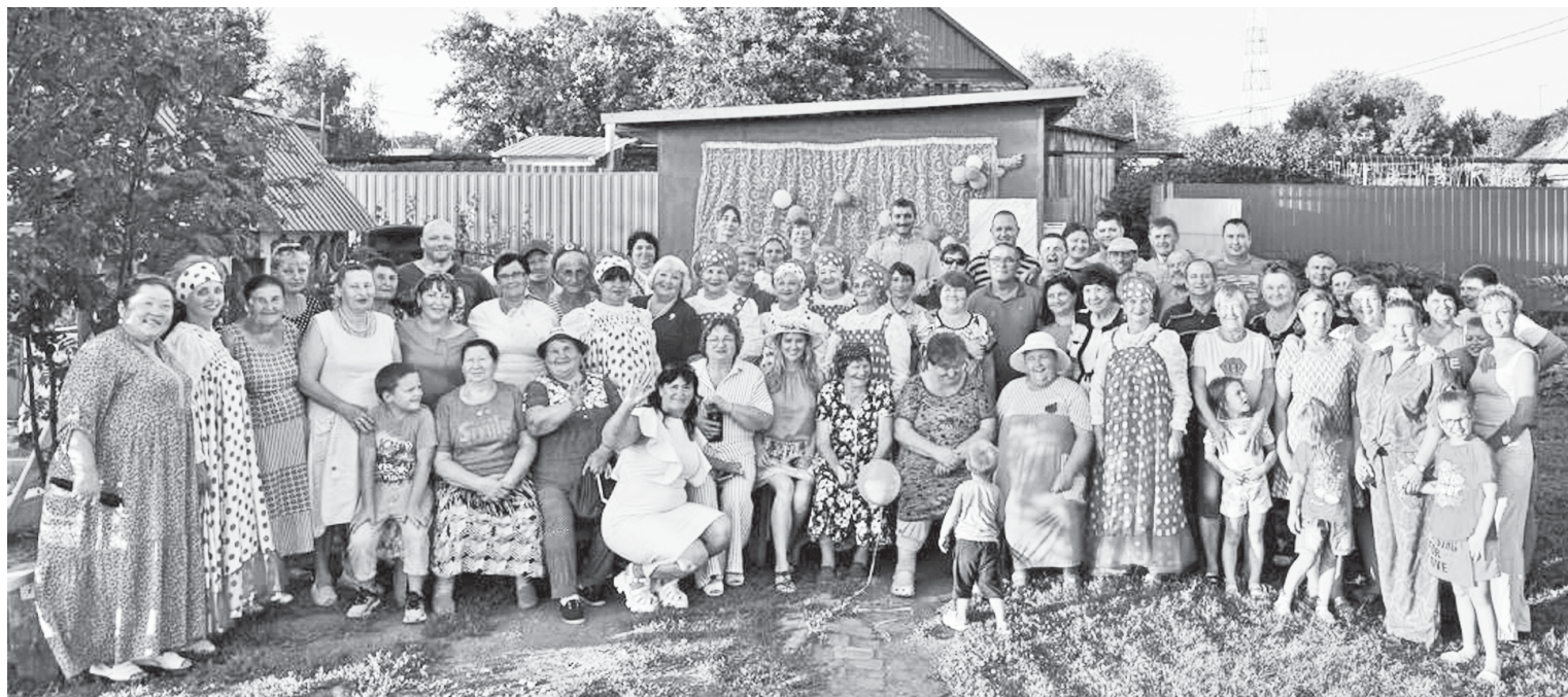
После концертной программы - фото на память.