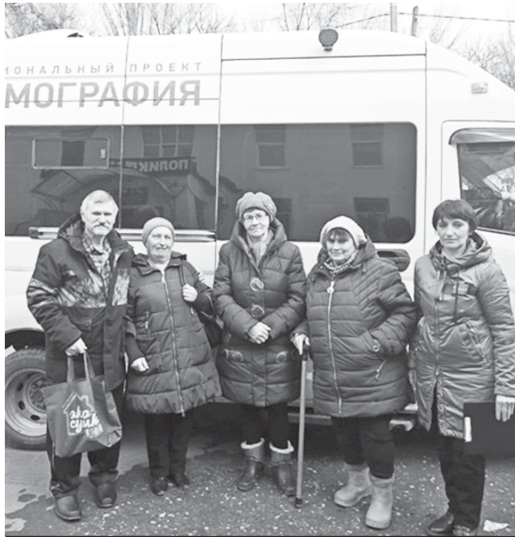
Сельские жители доставляются на диспансеризацию в районную больницу.