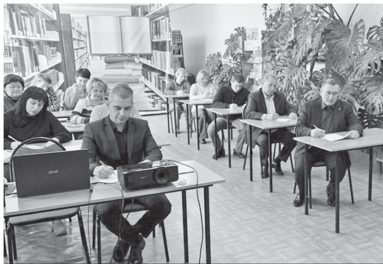
Агродиктант в библиотечном зале.