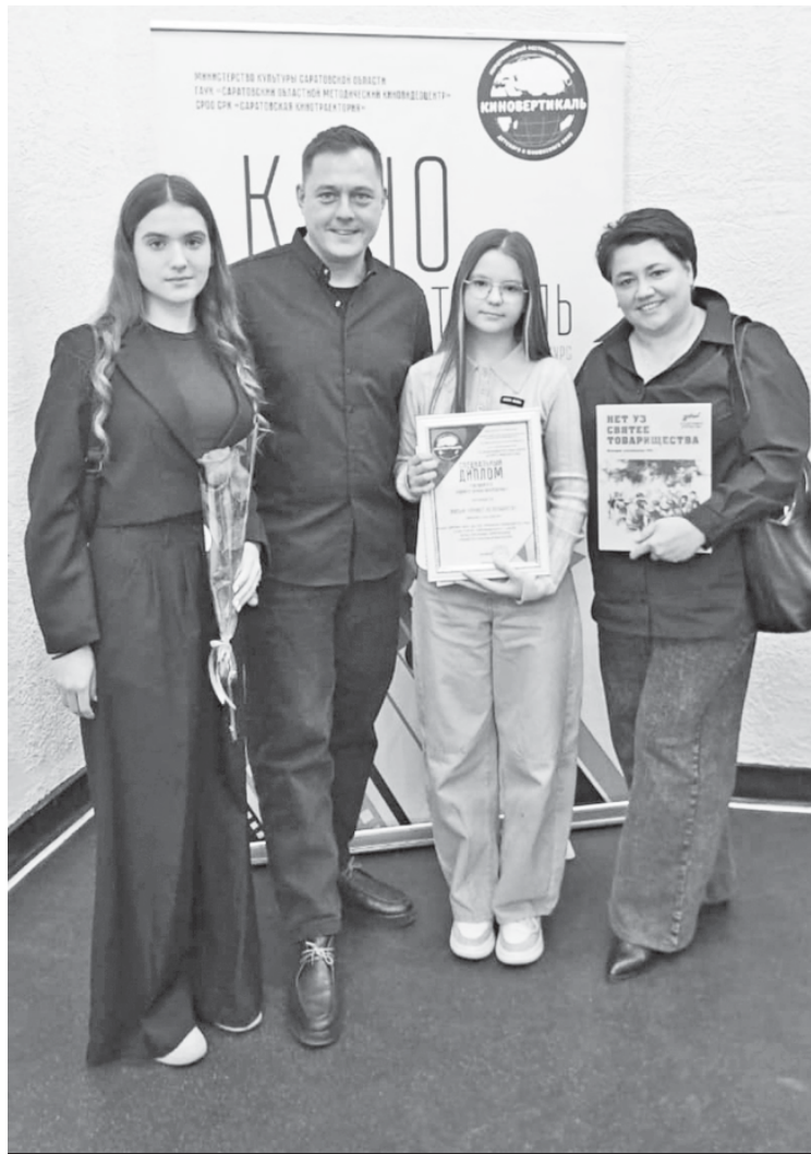
После церемонии награждения фотография на память.