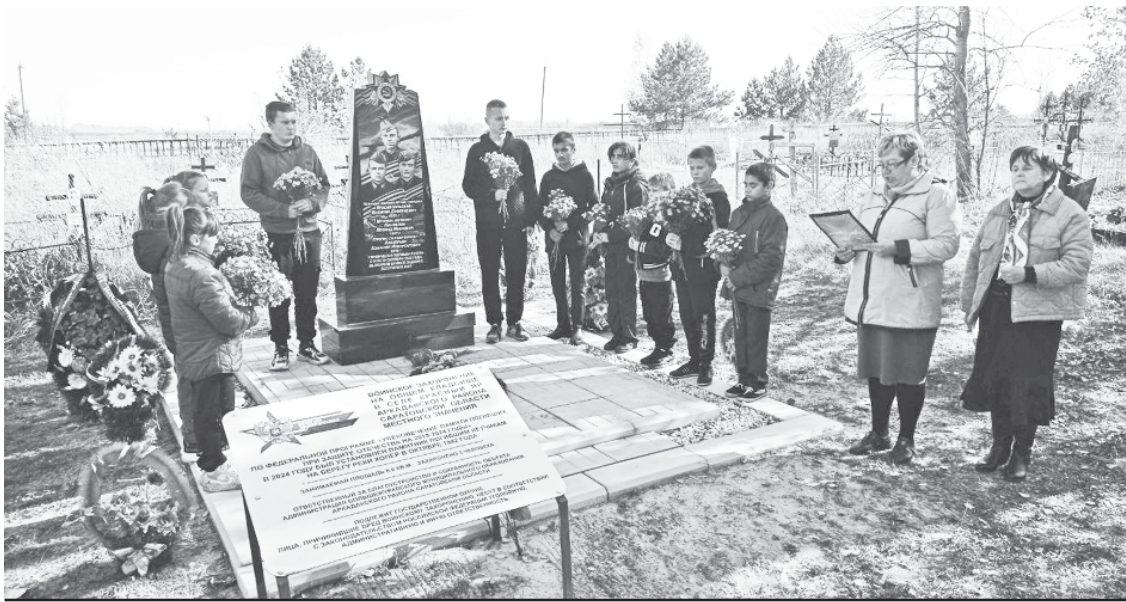
Акция "Память" на мемориале красноярского кладбища.