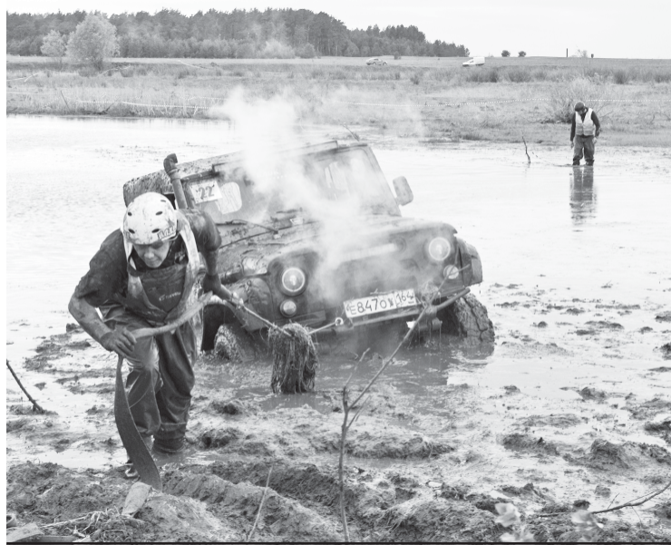
Преодолевать сложную трассу приходилось и так.