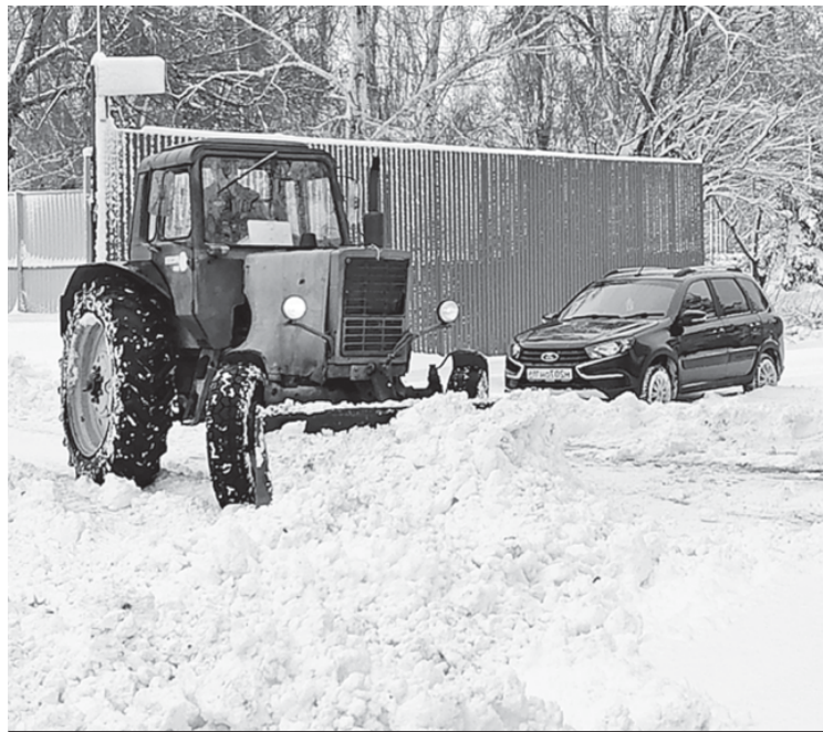
На расчистке аркадакских дорог от снега работает техника.

Светлана МАРЕЕВА.