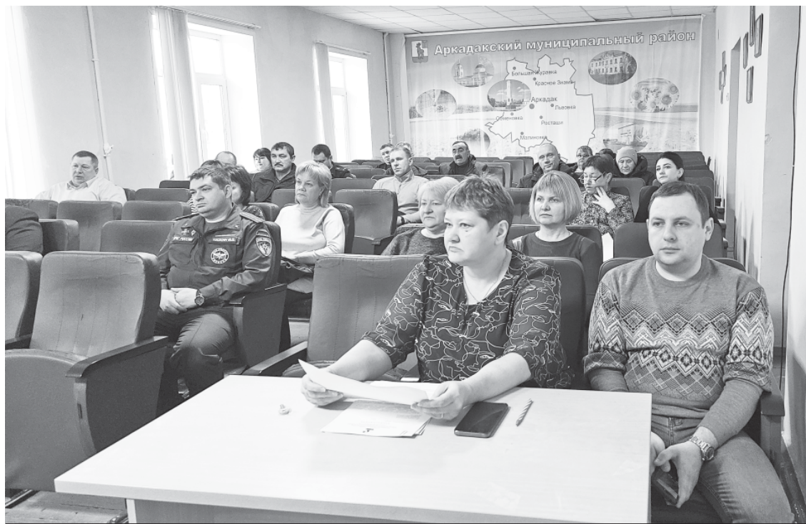
Заседание противопоаводковой комиссии.