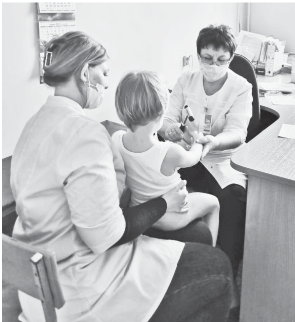
Идёт осмотр ребёнка.

Администрация Аркадакской районной больницы регулярно привлекает медиков из области для проведения диспансеризации аркадакских пациентов. Вот и на этот раз в Аркадак приезжали специалисты Саратовской областной детской больницы.