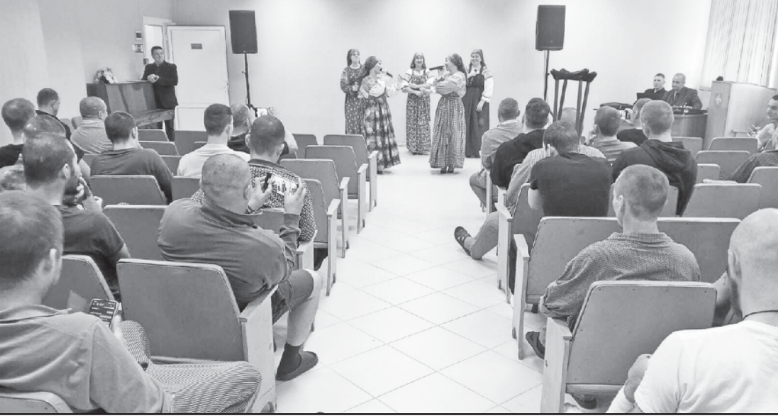
Выступает народный ансамбль "Родник".

всех тех, кто отдал жизни за Отечество. Наши артисты постарались хоть немного отвлечь мужчин от проблем и тревог, поднять им настроение. И у них это получилось. Громкие аплодисменты были наградой за каждый номер программы. В завершение выступления аркадакцы пожелали всем бойцам скорейшего выздоровления, а всем нам - Победы. Светлана МАРЕЕВА.