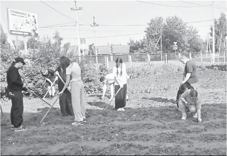
Учащиеся школы № 1 на пришкольном участке.