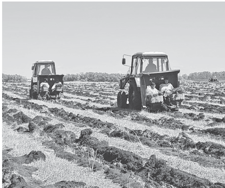
Высадка молодых деревьев.

На 2025 год запланировано засадить новым лесом 4 тысячи гектаров. Весной на территории региона высажено 2,2 тысячи