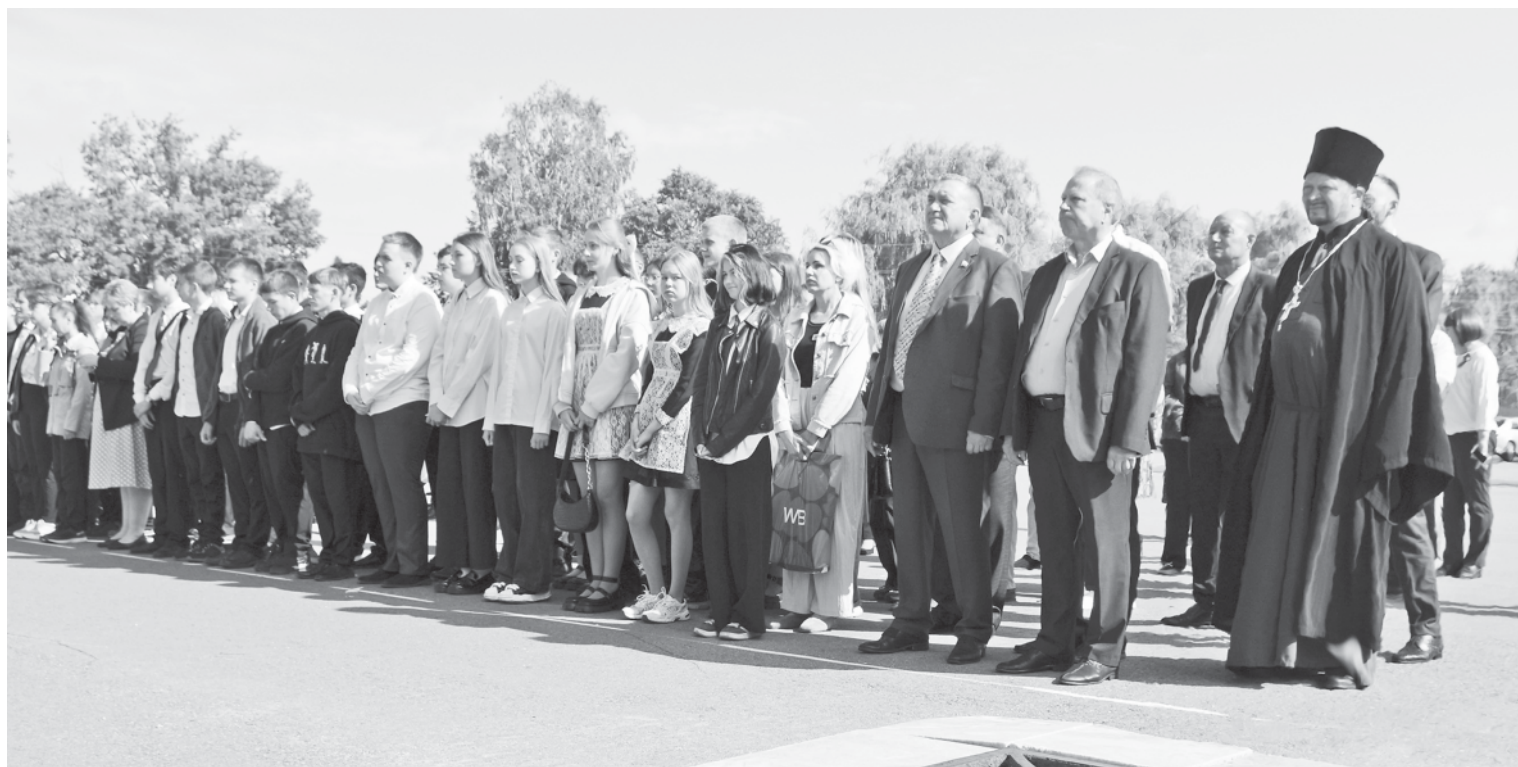
Минута молчания на митинге в День памяти и скорби.