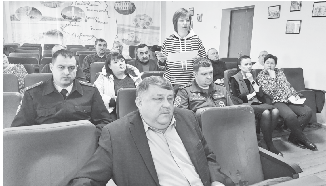
Представитель районной больницы отчитывается о запасе медикаментов.