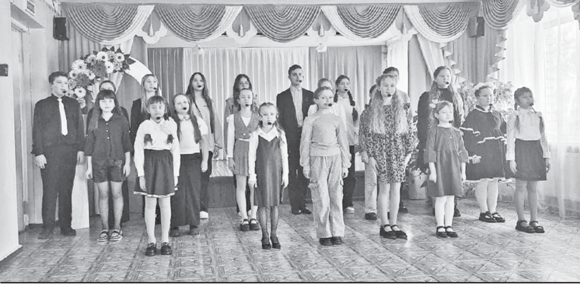
Фрагмент концерта.

Накануне Международного женского дня 8 Марта в Доме детского творчества состоялся концерт под названием "Весна с ароматом мимозы".