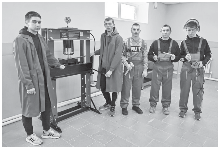
Участники конкурса профессионального мастерства.