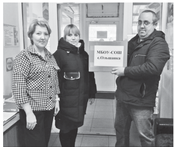
Ольшанцы передают собранную гуманитарную помощь для наших бойцов.

В формировании посылок активно принимают участие школьники района. Ребята с удовольствием собирают коробки, оформляют нужной символикой. Главное, у них есть понимание важности этой работы.