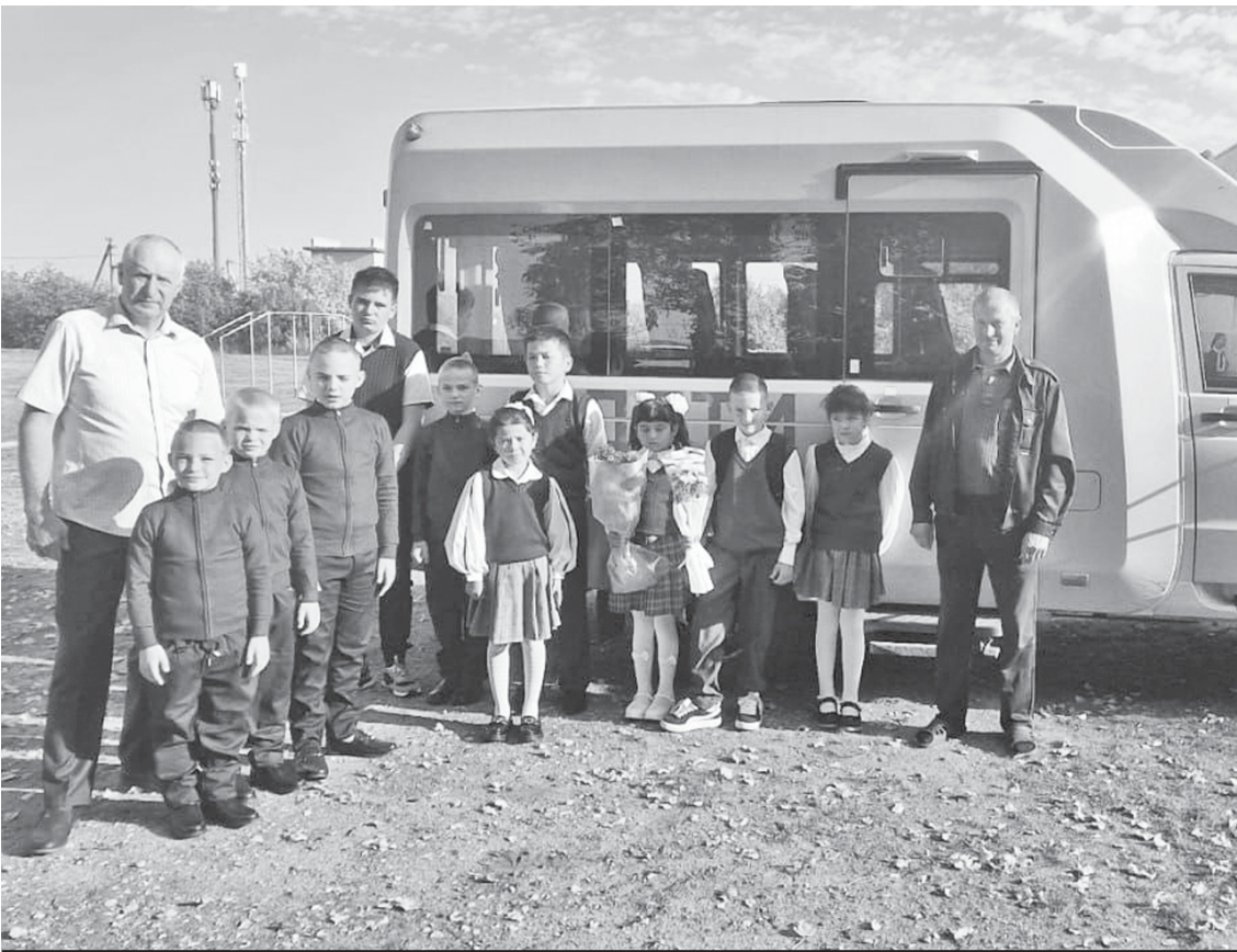
Школьный автобус к подвозу детей готов.