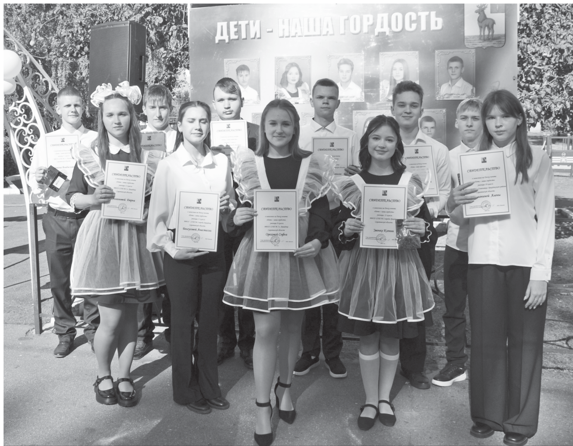
Аркадакские школьники, чьи имена занесены на районный стенд почёта.