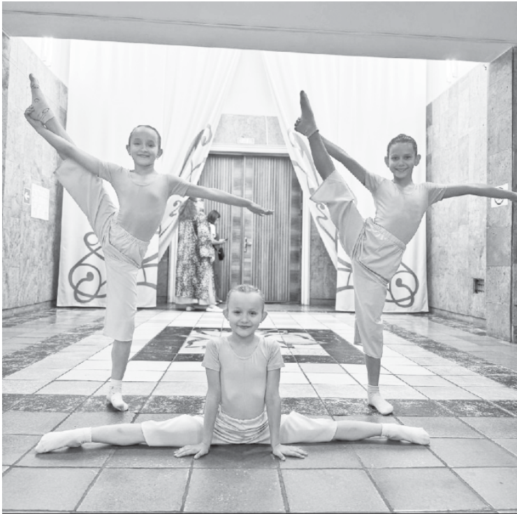
Участницы хореографического коллектива "Лотос"

В саратовском Дворце культуры "Россия" прошёл финал областного традиционного фестиваля танца всех стилей и направлений "Ритмы нового века" в младшей возрастной категории.