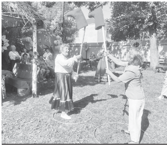
Старшее поколение с удовольствием участвовало в весёлых конкурсах.