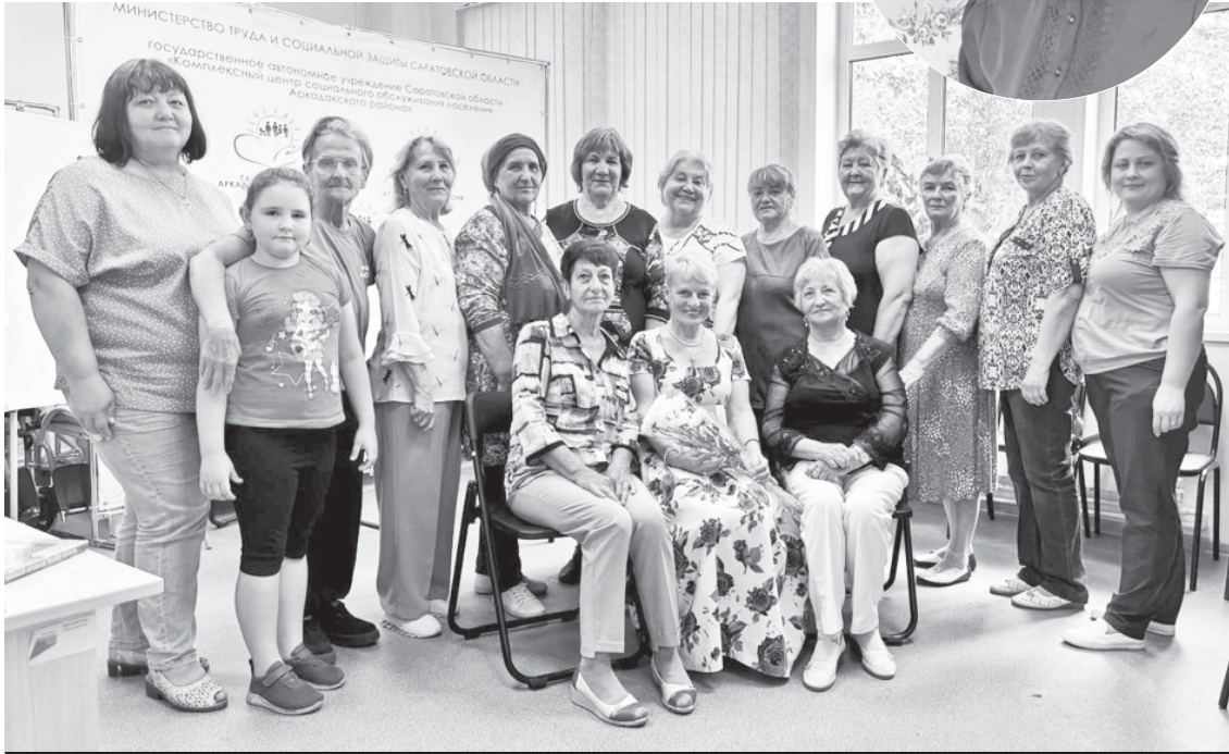
После встречи - фотография на память.