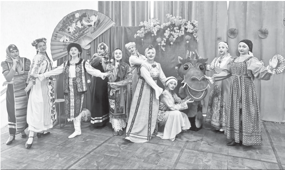
Студия моды "Золушка".

В этом ярком двухчасовом действе участвовали самые лучшие и великолепные номера - победители областного открытого фестиваля-конкурса народного творчества "Русско- Китайская палитра" от всех районных домов культуры.