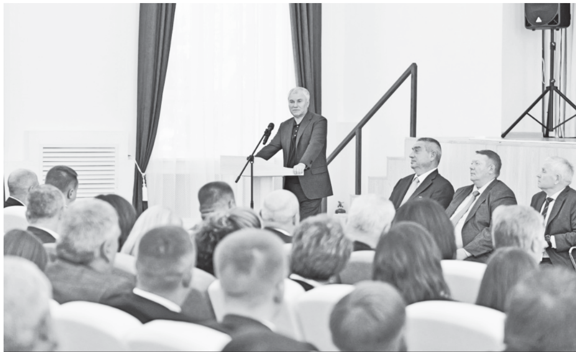
Вячеслав Володин на встрече с активом области.

Вячеслав Викторович поделился своими соображениями по указанным темам, рассказал о планах по развитию региона, в том числе о реализации крупных проектов, таких как строительство двух обходов - Южного, вокруг Саратова, с мостовым переходом через Волгу, и вокруг Пугачёва, реконструкция железнодорожного вокзала Саратова и Балаковского аэропорта, продолжение реализации проекта скоростного трамвая в Саратове, по строительству в городе канатной дороги, соединяющей областной центр и Энгельс и обеспечивающей доступ жителям на остров посреди Волги, где они могли бы отдыхать. По мнению политика, эти проекты откроют новые возможности для экономики области.