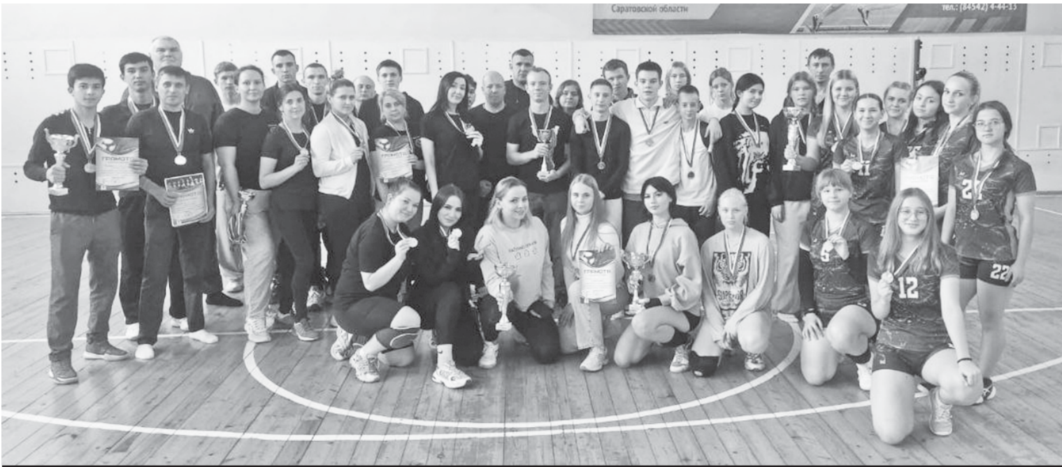
Победители спартакиады.

Спартакиада - это своеобразный итог работы учреждений и организаций района по развитию физической культуры и спорта, по вовлечению детей, молодёжи и взрослого населения к занятиям спортом, популяризации здорового образа жизни.