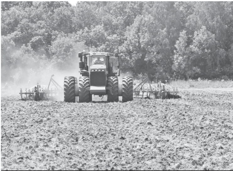
На аркадакских полях.

Светлана МАРЕЕВА.