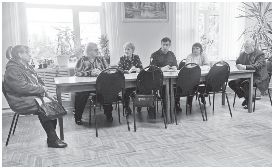
На приёме у главы.