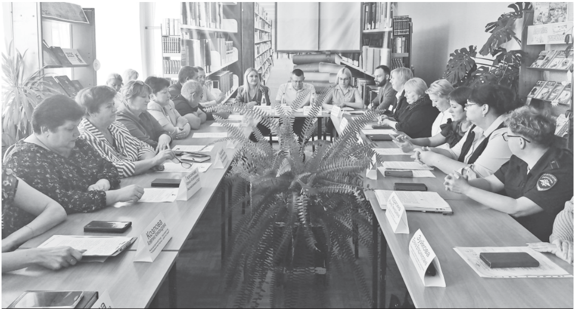
Заседание комиссии по делам несовершеннолетних и защите их прав при администрации Ардакского района в формате круглого стола.

Ребёнку от рождения принадлежат и гарантируются государством права и свободы человека и гражданина в соответствии с Конституцией Российской Федерации. Органы государственной власти Российской Федерации, органы государственной власти субъектов Российской Федерации, должностные лица указанных органов в соответствии со своей компетенцией содействуют ребёнку в реализации и защите его прав и законных интересов.