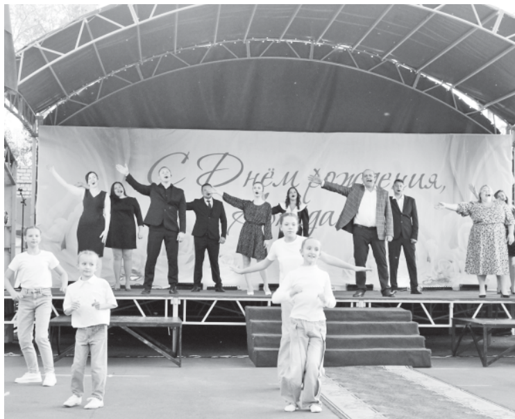
Заключительная песня концерта в честь 304-летия Аркадака.