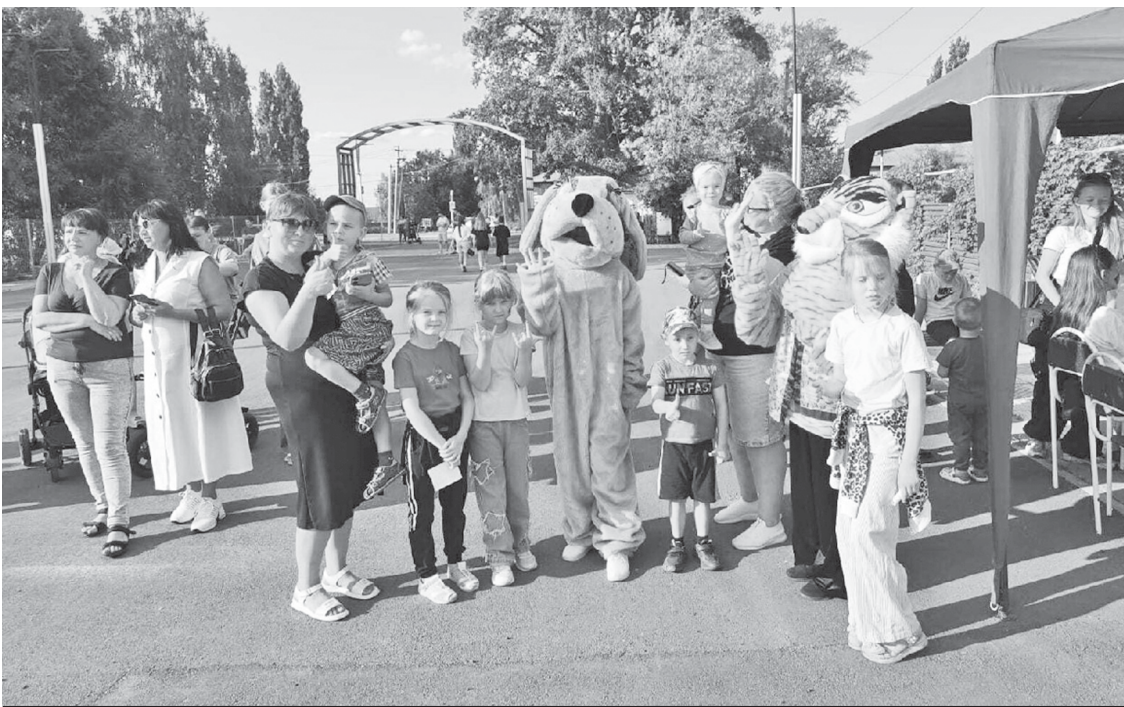
Аркадакцы отлично провели время на празднике микрорайона.

В Аркадаке продолжают культурные мероприятия, направленные на сближение людей, проживающих в различных микрорайонах города, раскрытие их талантов и просто создание хорошего настроения. Проводят эти мероприятия работники районного Дома культуры.