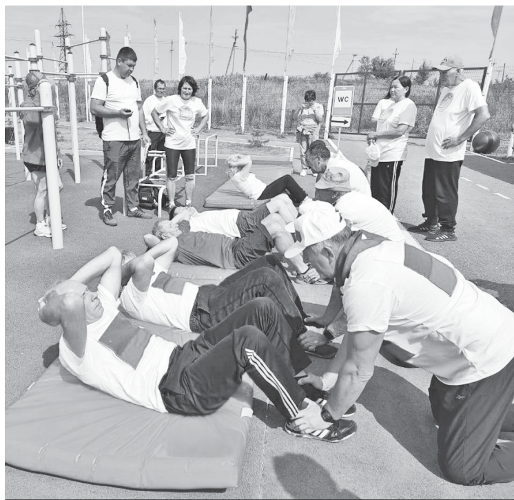
Этап спортивного соревнования - выполнение нормативов комплекса ГТО.

Спортивные состязания проходили в р.п. Татищево на стадионе "Энергия". Среди участников соревнования были команды из 38 муниципальных районов Саратовской области.