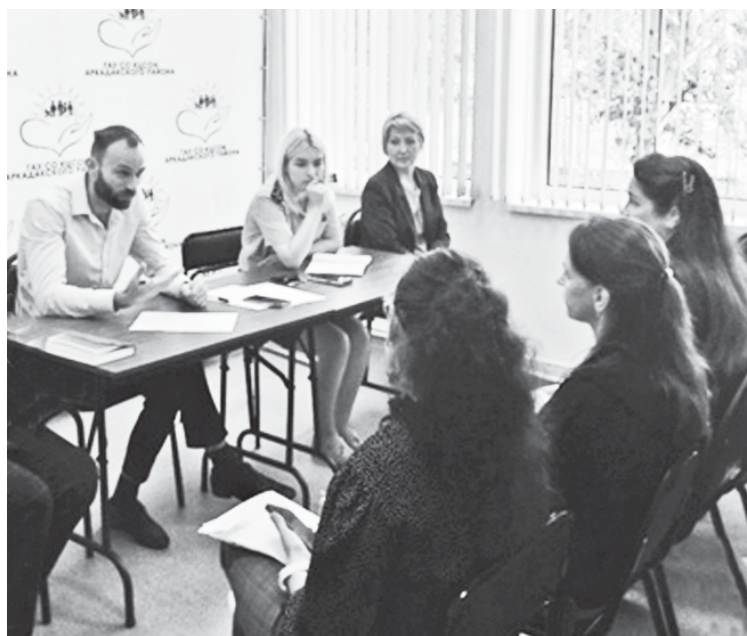
На встрече с гражданами с ограниченными возможностями здоровья и родителями детей-инвалидов.