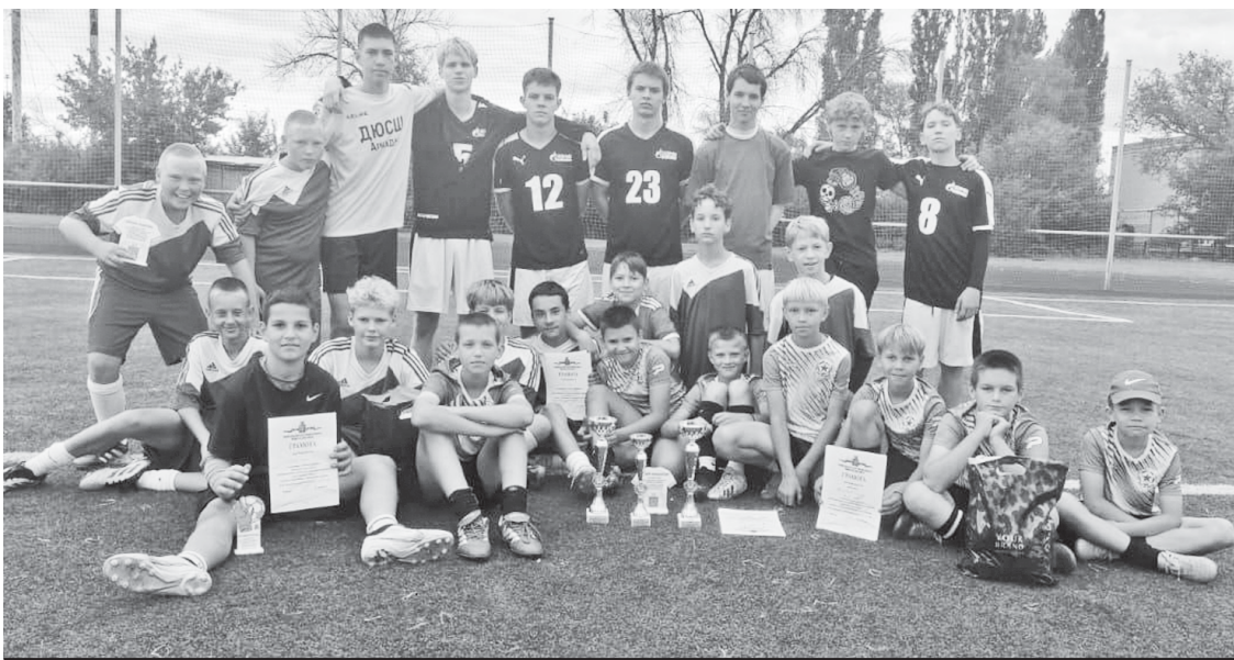
Аркадакские футболисты.