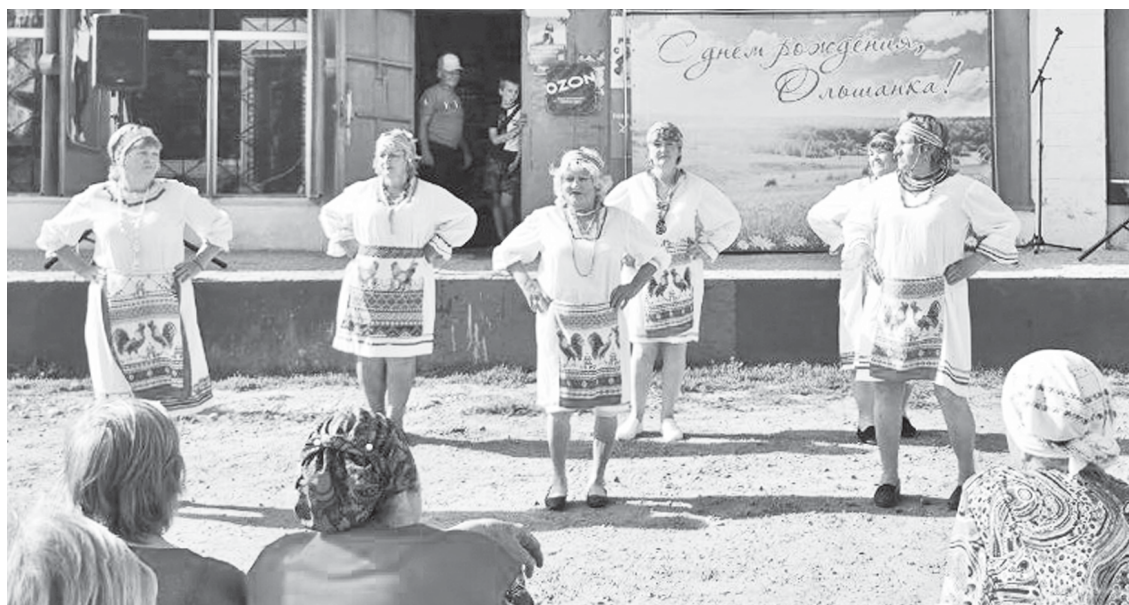
Фрагмент концертной программы.