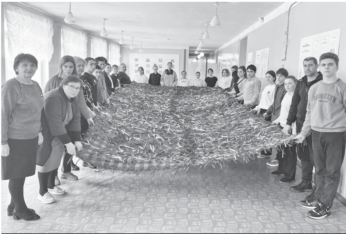
Маскировочная сеть от росташовцев.

Скоро маскировочная сеть из Росташей будет доставлена в зону боевых действий.