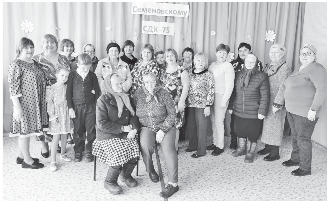
После праздника - фотография на память.

Сельский Дом культуры... С каждым из них у сельских жителей связано много воспоминаний. Так и Семёновский Дом культуры за долгую свою историю стал знаковым местом для жителей села. На днях здесь отметили 75-летний юбилей сельского очага культуры.