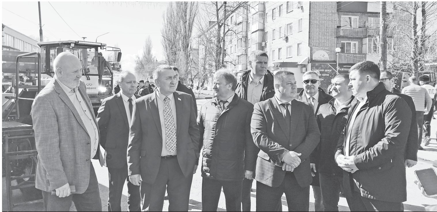
Участники совещания посетили выставку сельскохозяйственной техники.