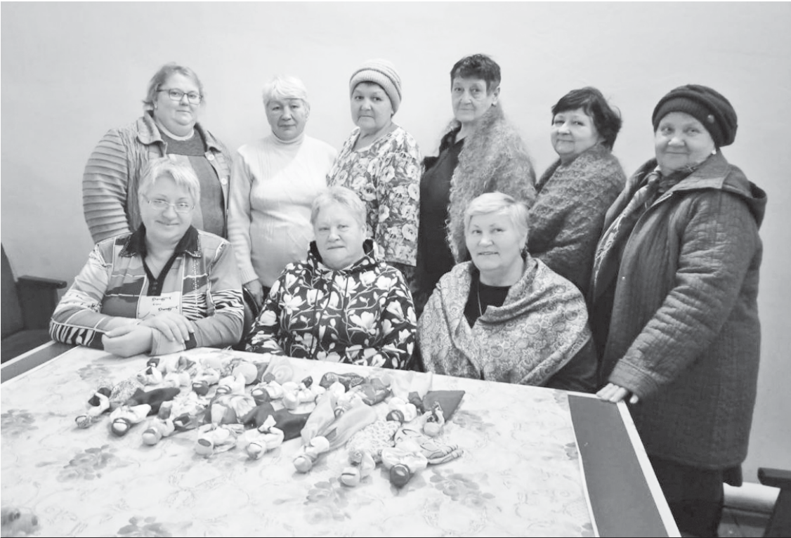
Участницы объединения "Хлопотушки".

С 2023 года при Кистендейском культурно-досуговом центре создано женское любительское объединение "Хлопотушки". В его составе неравнодушные женщины, которые заняты общим делом помощи нашим защитникам на СВО.