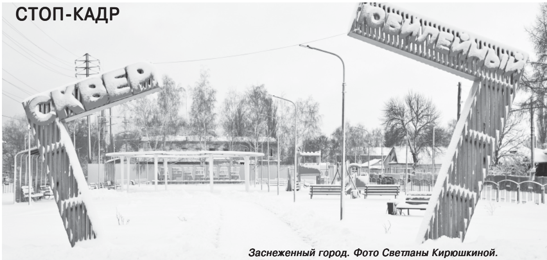
Заснеженный город.