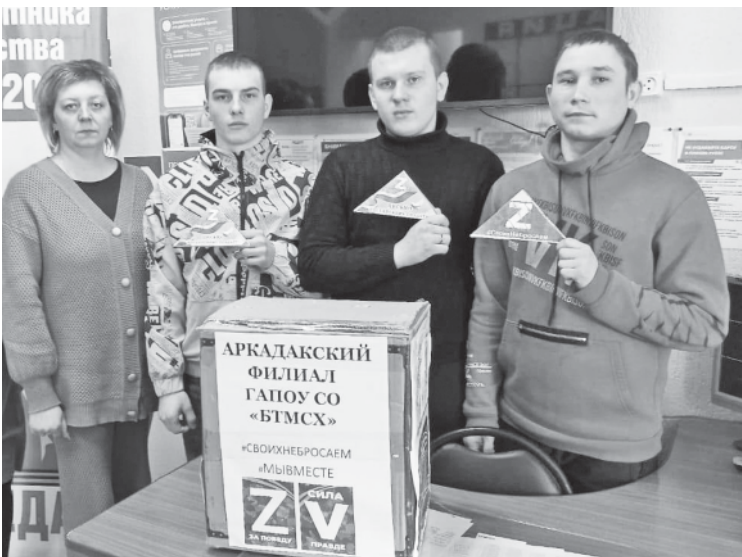
Студенты и преподаватели техникума привезли гуманитарную помощь.

Сотрудники и студенты Аркадакского техникума механизации сельского хозяйства присоединились к акции по сбору гуманитарной помощи для участников специальной военной операции.