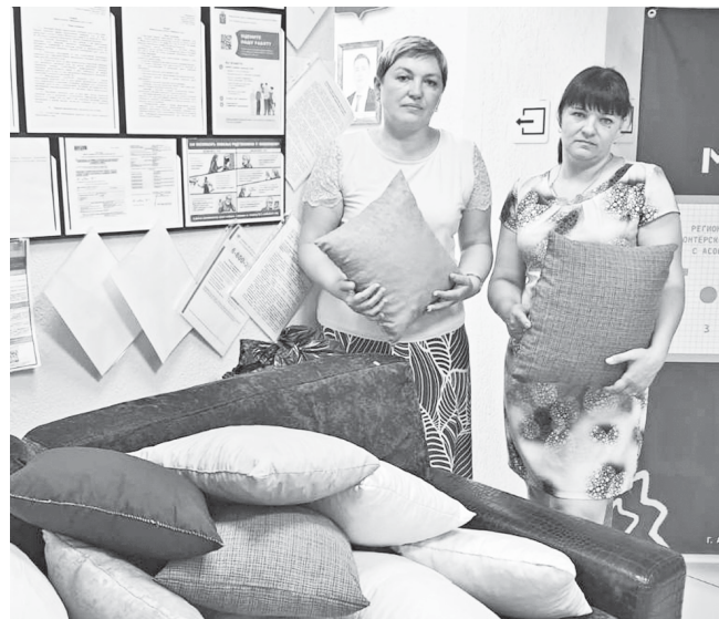
Работницы детского сада принесли подушки в пункт сбора гуманитарной помощи.