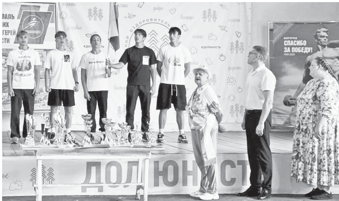
Момент награждения на фестивале.