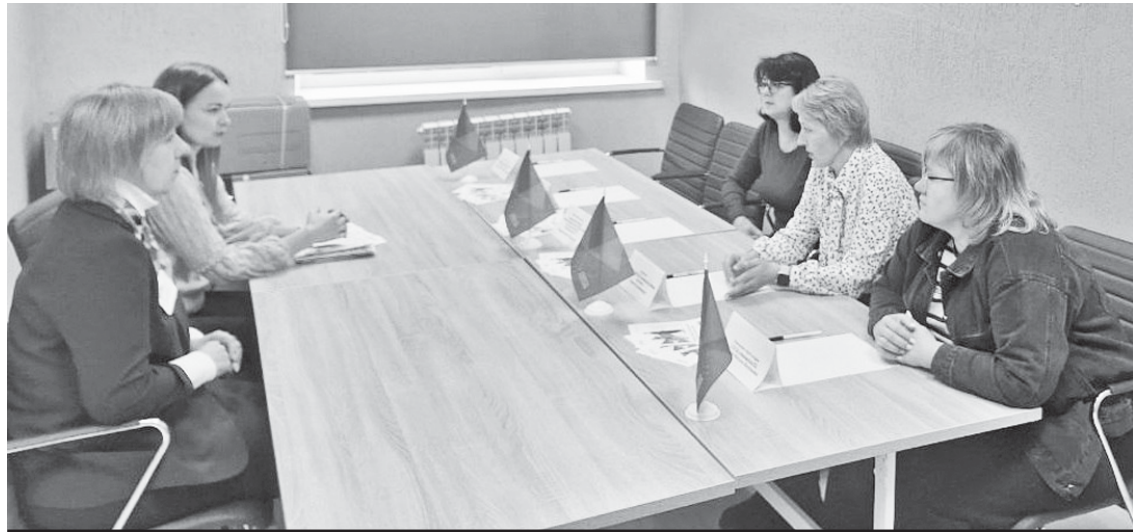
Идёт заседание клуба работодателей.