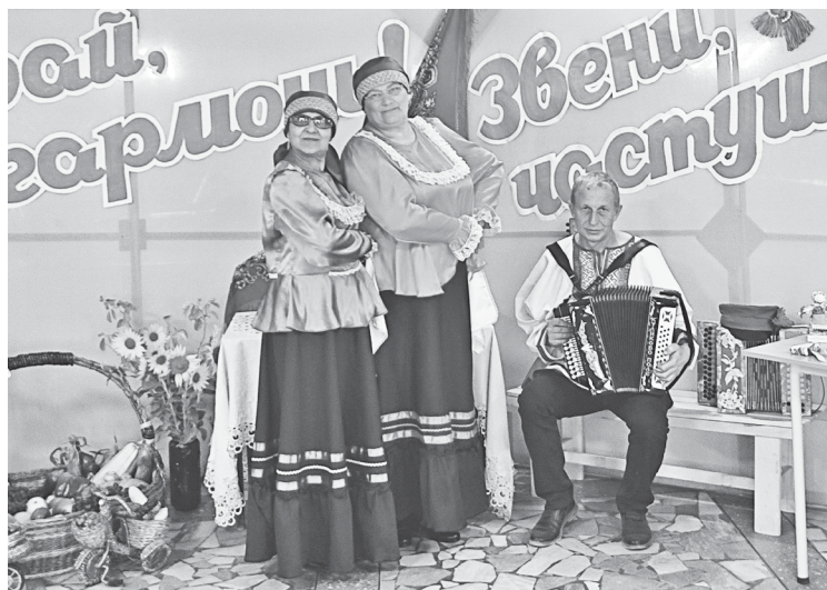
Команда Аркадакского района.

Наша команда, которая представляла Аркадакский район на восьмом областном фестивале-конкурсе "Играй, гармонь, звени, частушка!" показала себя во всей красе.