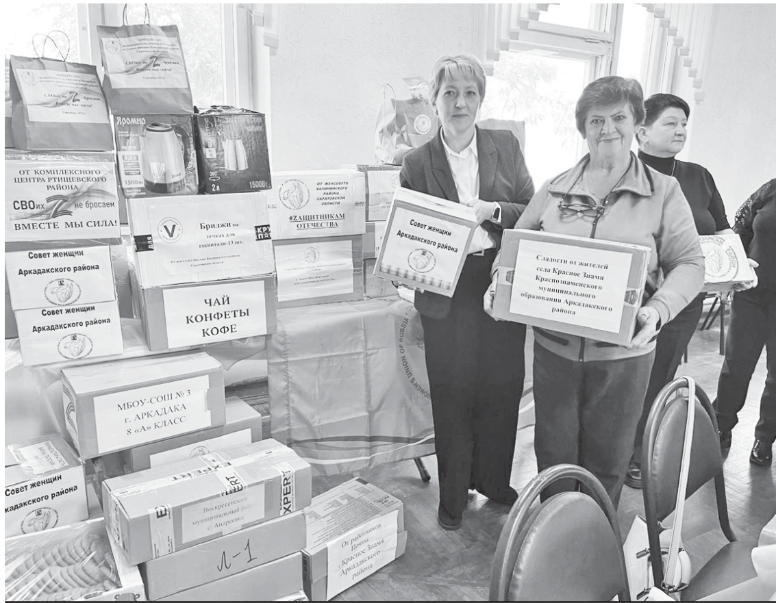
Аркадакские женщины передали в госпитале бойцам подарки.