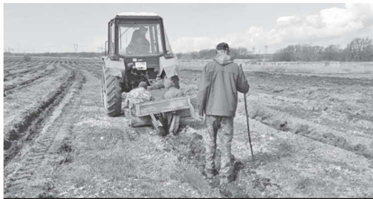
Идёт посадка сеянцев дуба.