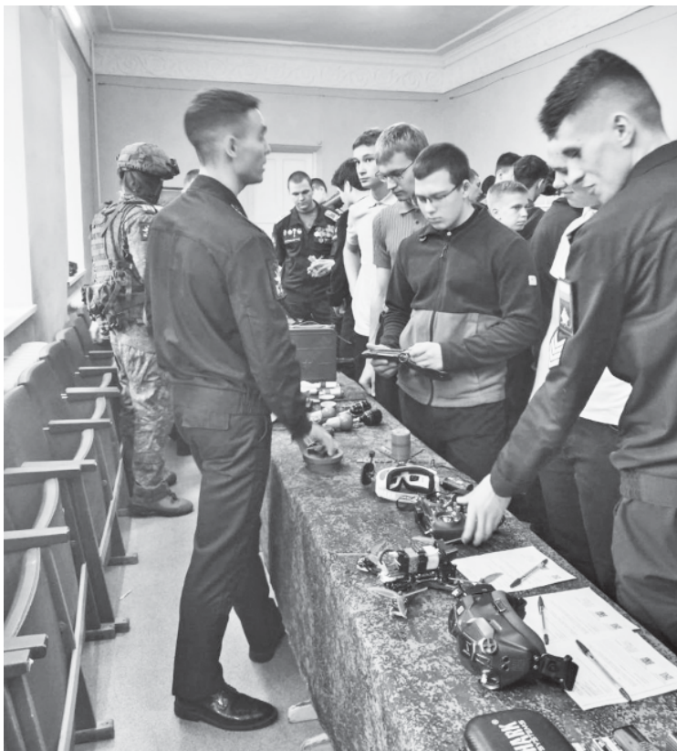
Курсанты военно-воздушной академии демонстрируют современное высокотехнологичное оборудование.

Передюношами выступил один из выпускников академии, а в настоящем участник специальной военной операции. Он рассказал, что его профессия связана с защитой неба Родины, что учёба в академии дала ему многое для профессионального роста.