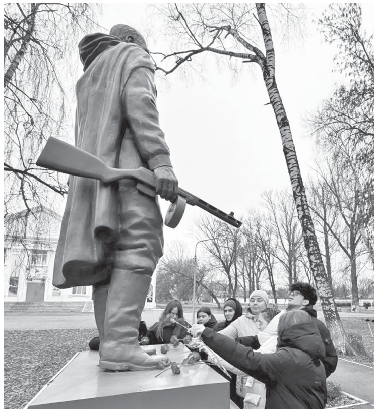
Возложение цветов к памятнику Воину-победителю.