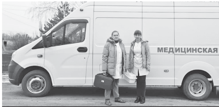
Медицинская бригада к выезду готова.