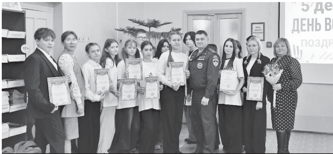
После мероприятия - фотография на память.