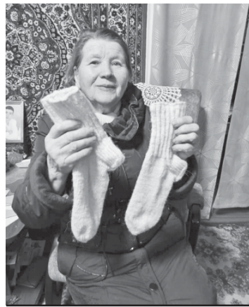
Носки на фронт от чиганакцев.