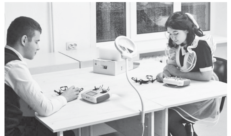
В специализированном классе беспилотных авиасистем.

Губернатор подчёркивает, что если спрос значительно превышает предложение, необходимо искать решения по расширению приёма на данные направления.