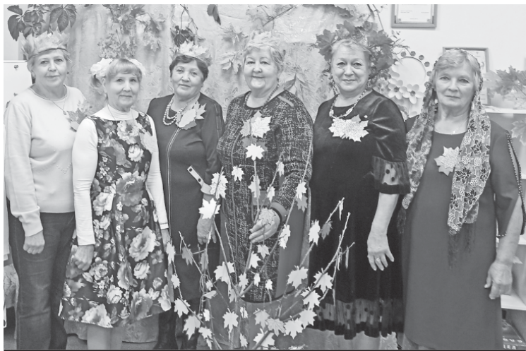
Участники конкурсно-развлекательной программы.