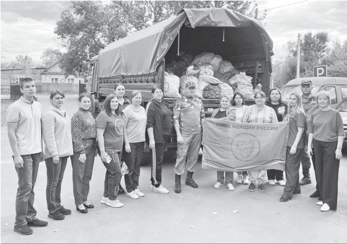
Аркадакцы загрузили гумпомощью военный КамАЗ.

с помощью волонтеров загрузили КамАЗ-десятитонник, успели пообщаться с активистками из женсовета и передали через них слова благодарности всем неравнодушным жителям района.