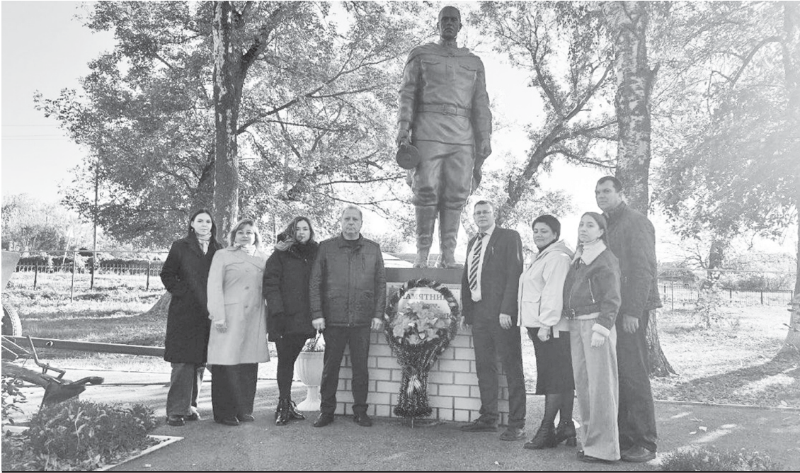
Возложение цветов и венков к памятнику воину-победителю.

В День воссоединения ДНР, ЛНР, Запорожской и Херсонской областей с Россией состоялось торжественное возложение цветов и венков к памятнику воину-победителю в городском парке.